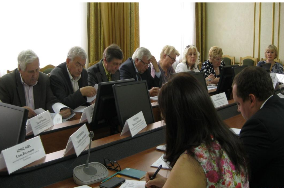
Заседание Общественного совета

Протокол заседания Общественного совета от 12 сентября 2016 года № 10