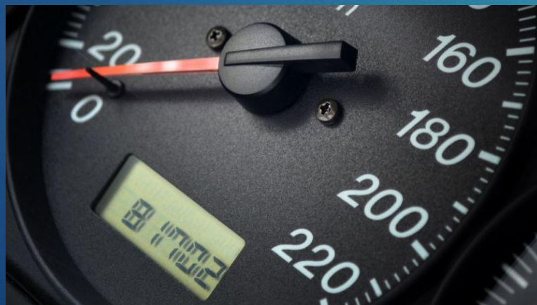
Годового пробега автомобиля