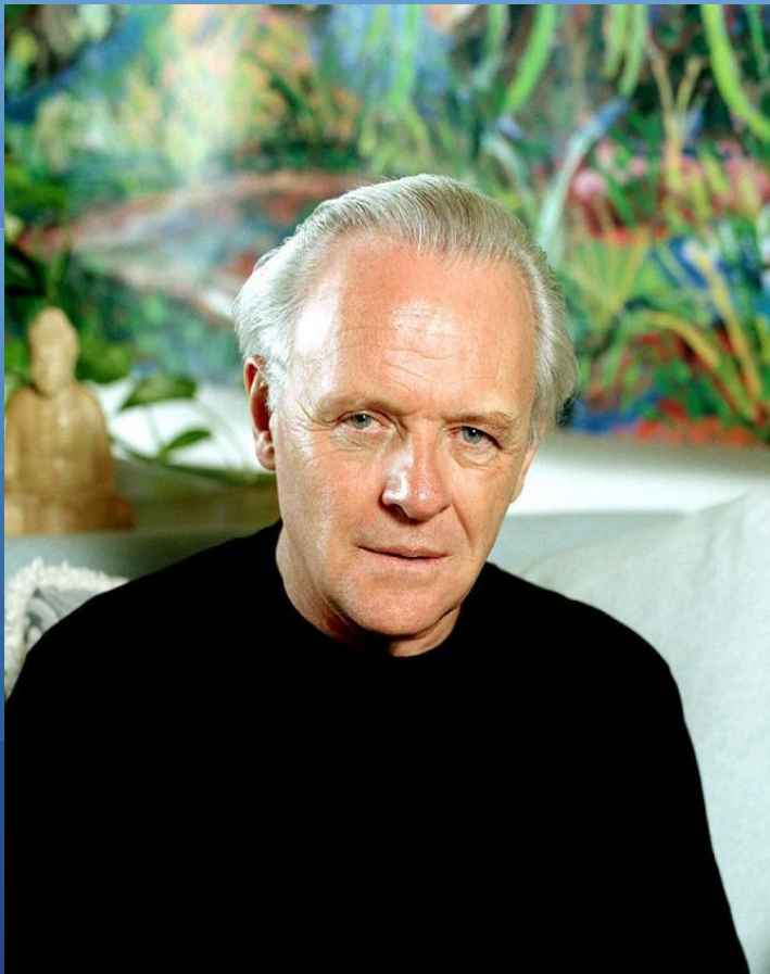
Энтони Хопкинс Торвальд Хельмер