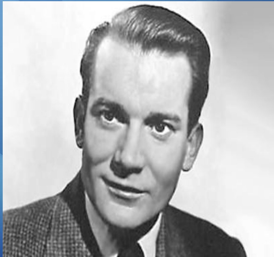
Денхолм Эллиот Крогстад