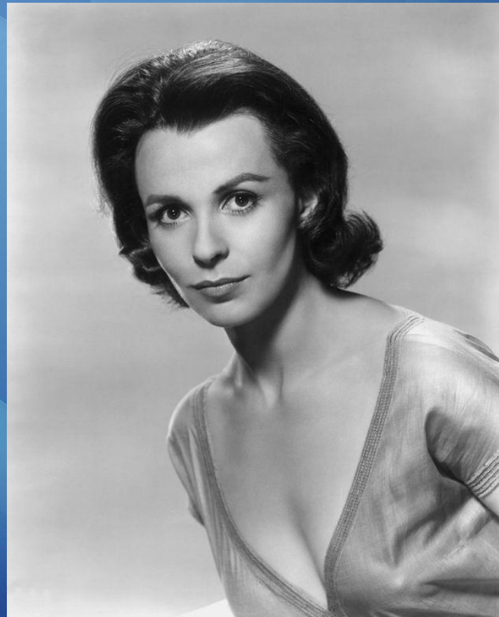
Клер Блум Нора Хельмер