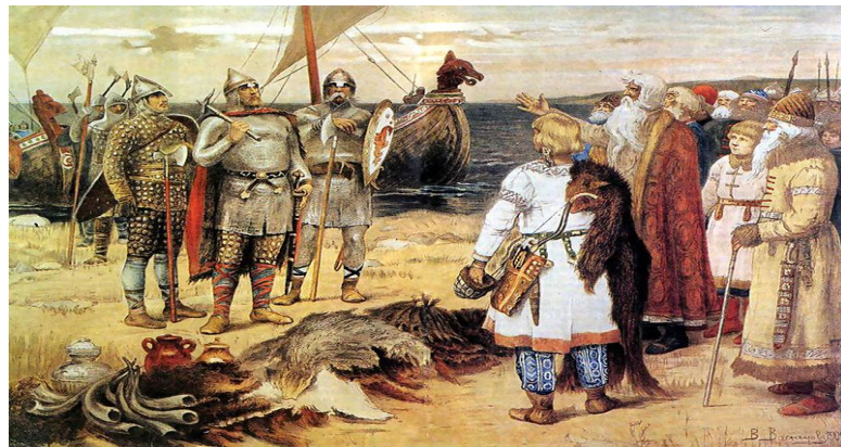
Призвание варягов. В. М. Васнецов

Оба государственных центра, образовавшихся в восточнославянских землях, называли себя Русь .