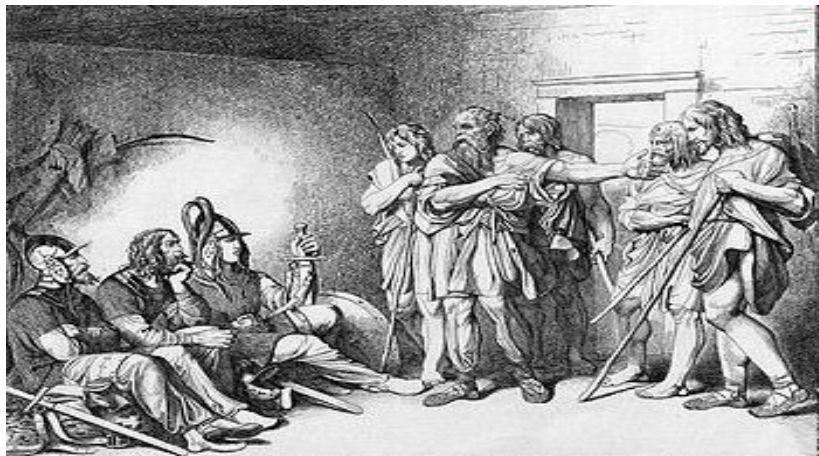
Призвание варягов. Ф.А. Бруни, 1839

862 г. – новгородцы призывают варягов – Рюрика , Синеуса и Трувора на княжение в Новгород