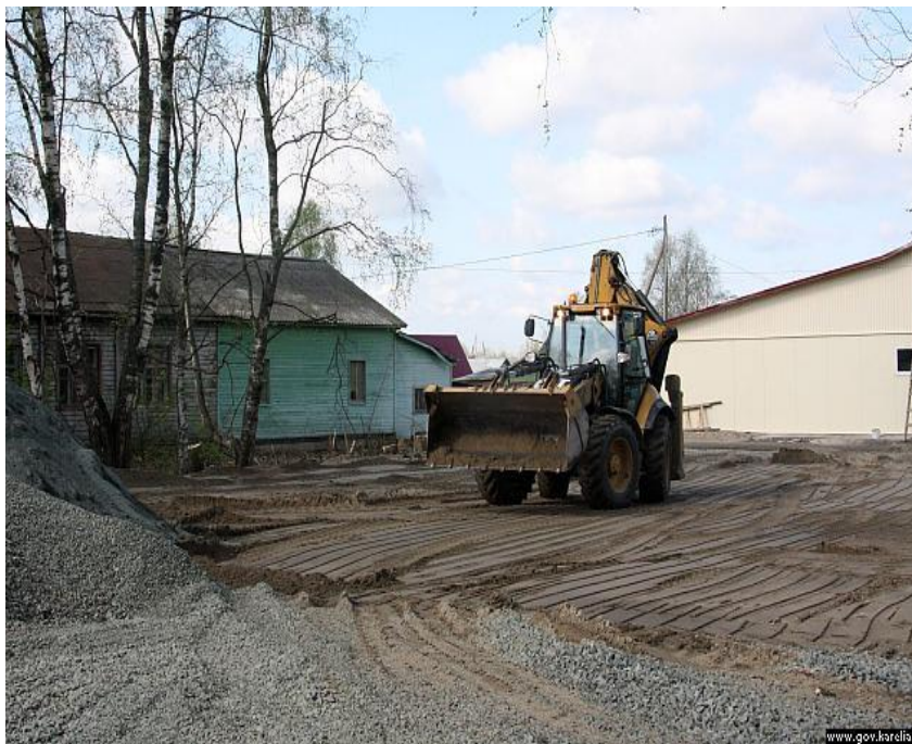
Строительство детской игровой площадки в д.Рыпушкалица