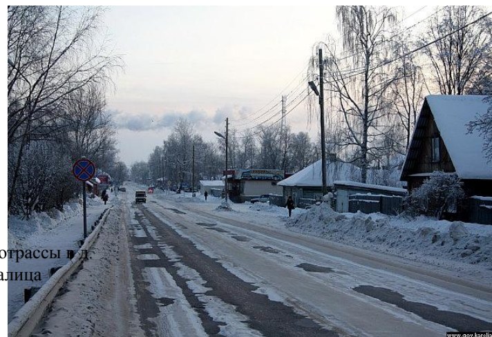
Освещение автотрассы в д. Рыпушкалица