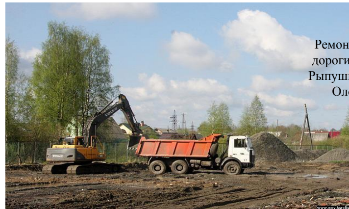
Ремонт участка дороги между д. Рыпушкалица и г. Олонцом