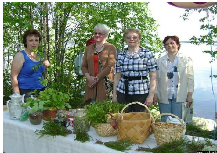
На празднике Дня Олонецкого района