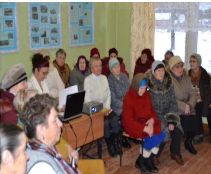
Открытое заседание Общественного совета д. Рыпушкалица

Общественный совет д. Рыпушкалица Олонецкого национального муниципального района создавался для решения проблем жилищно-коммунального обеспечения данного населённого пункта.