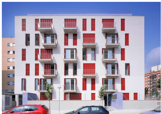
Многоквартирный жилой дом