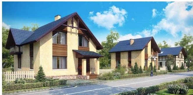
Сельский населенный пункт