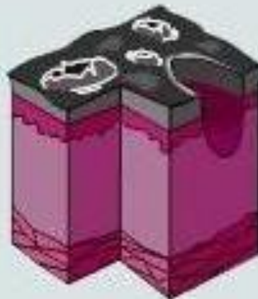
Ожог третьей степени