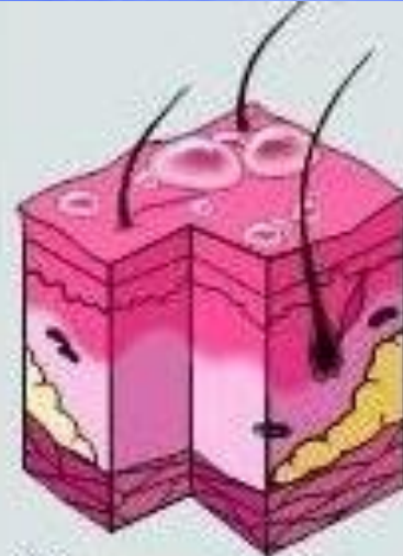
Ожог второй степени