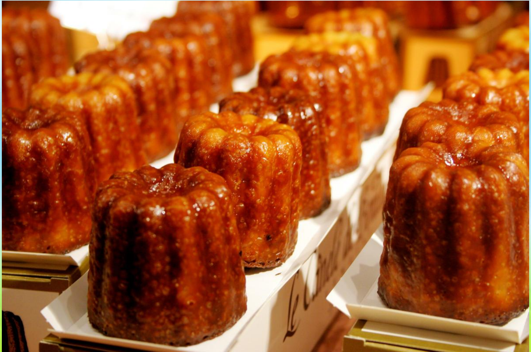
Канеле — Canelé