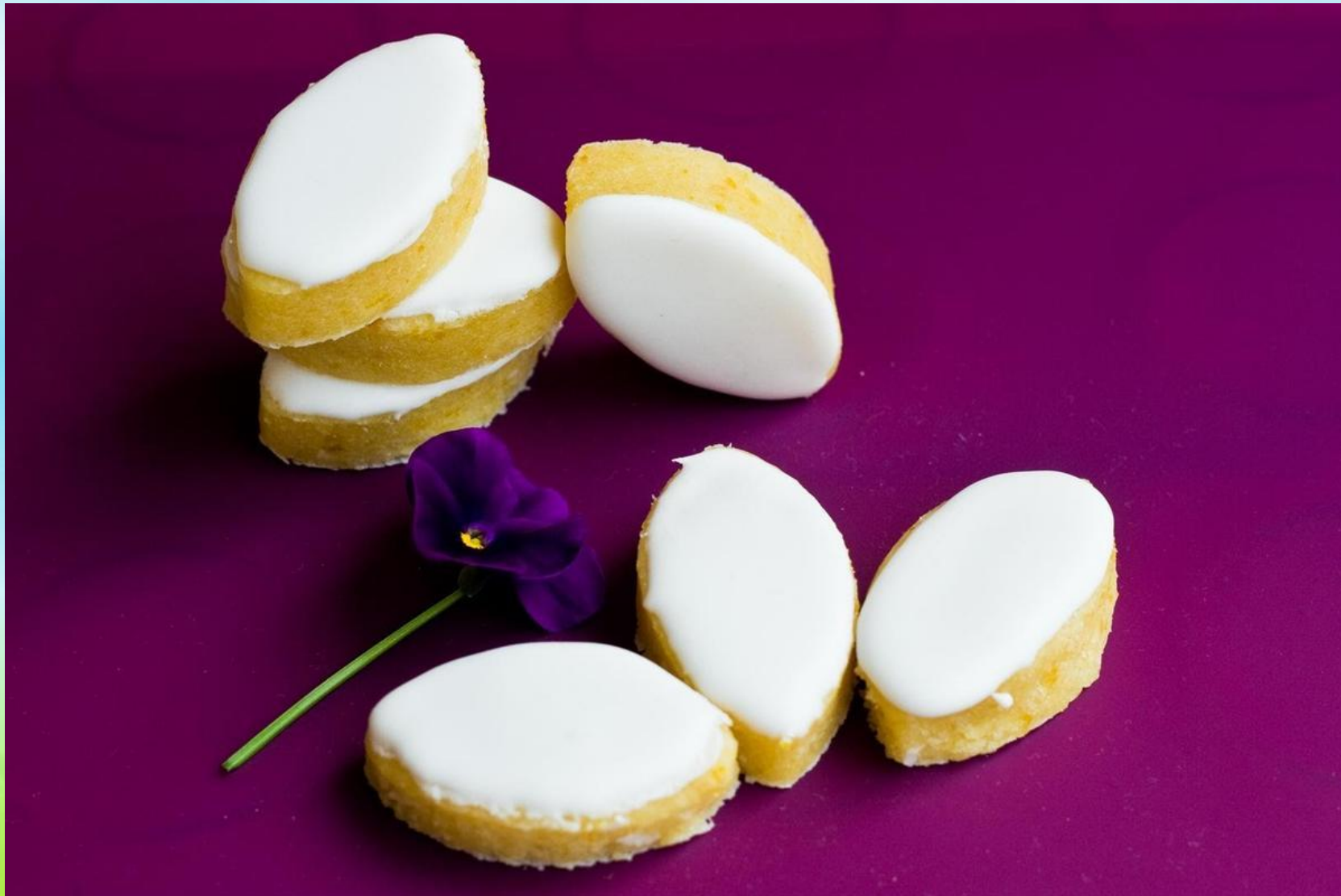
Калиссоны — Calisson