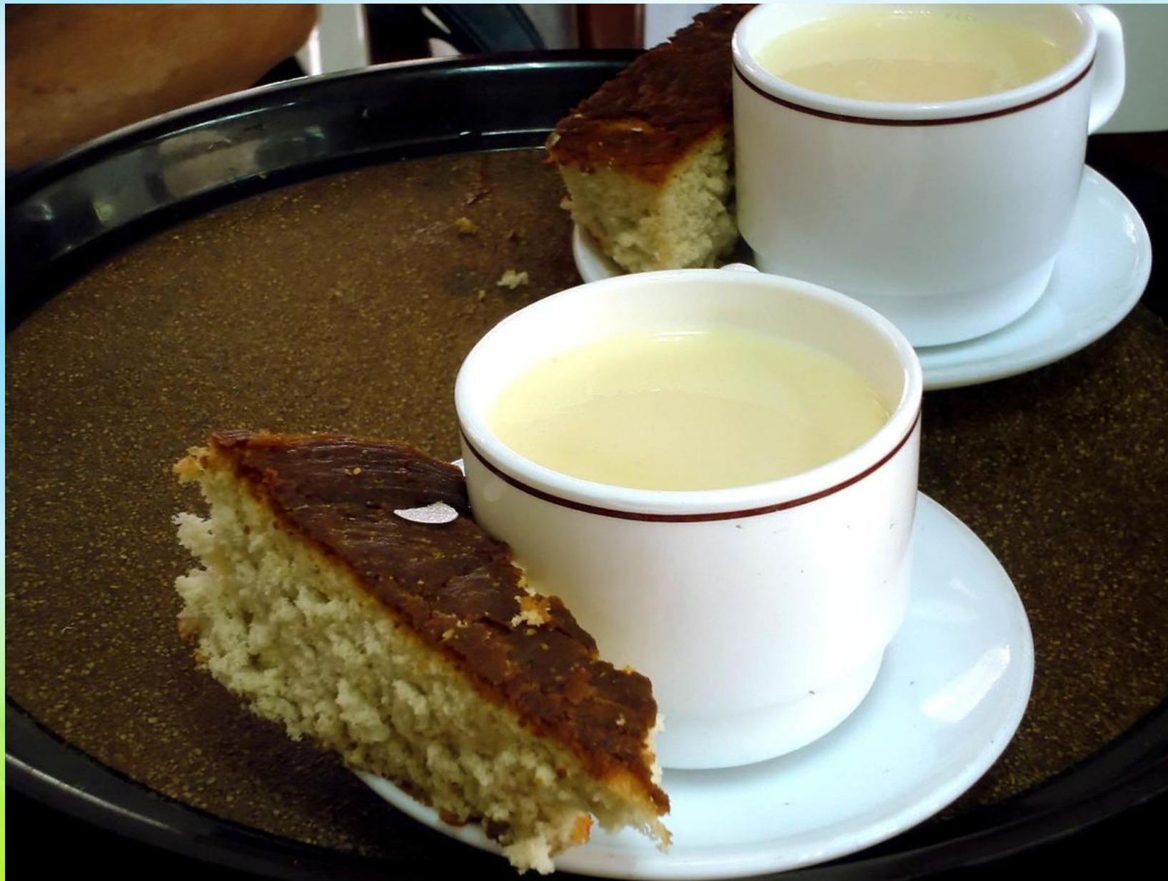
Шодо — Chaudéau