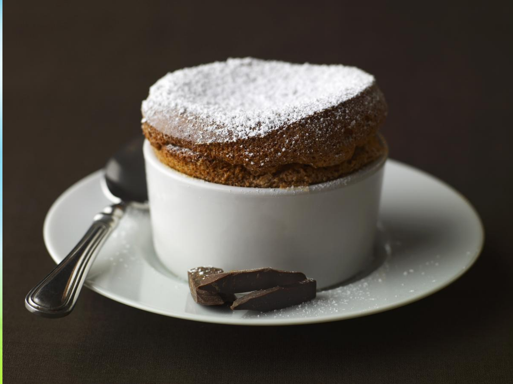
Суфле — Soufflé