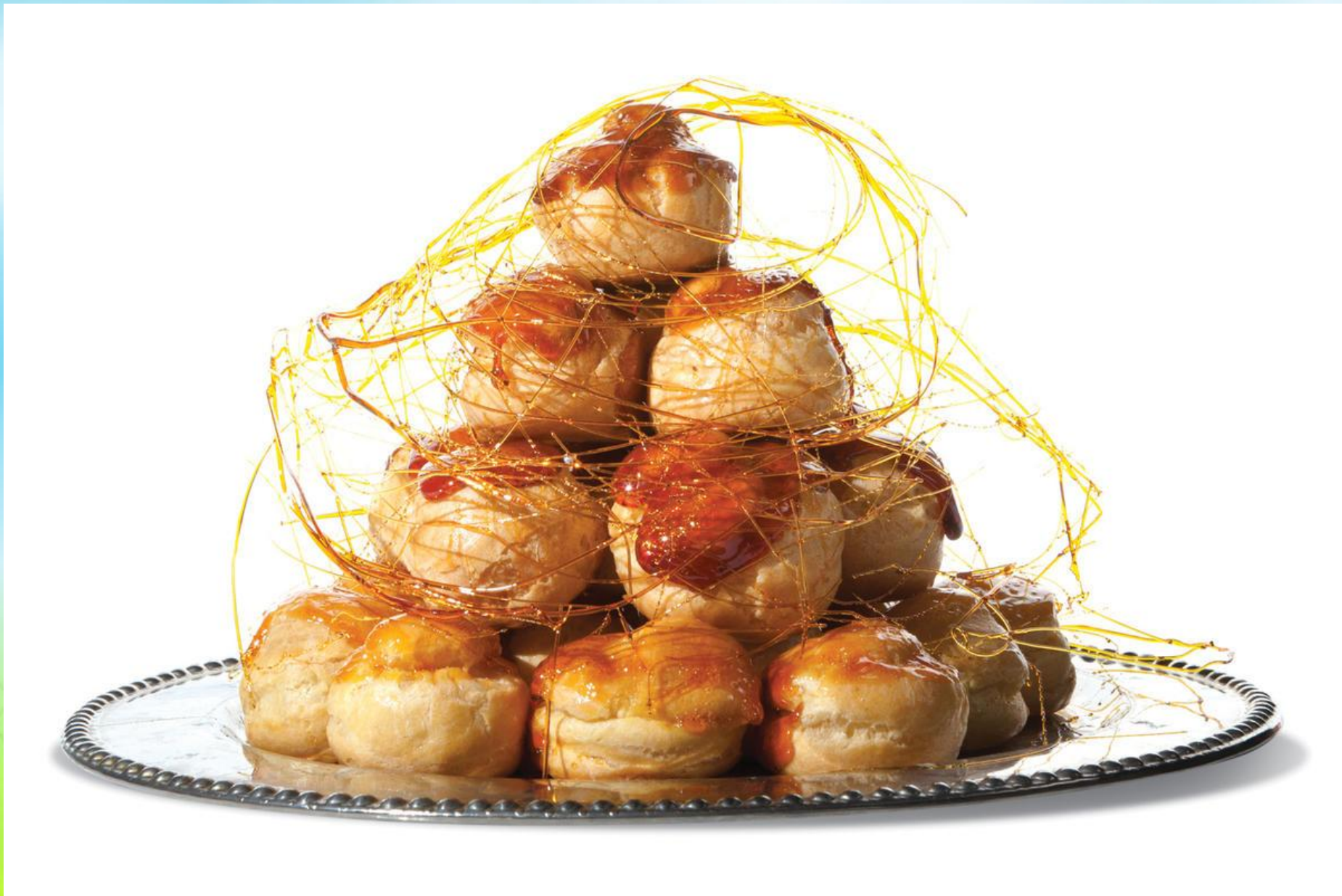
Крокембуш — Croque-mouche