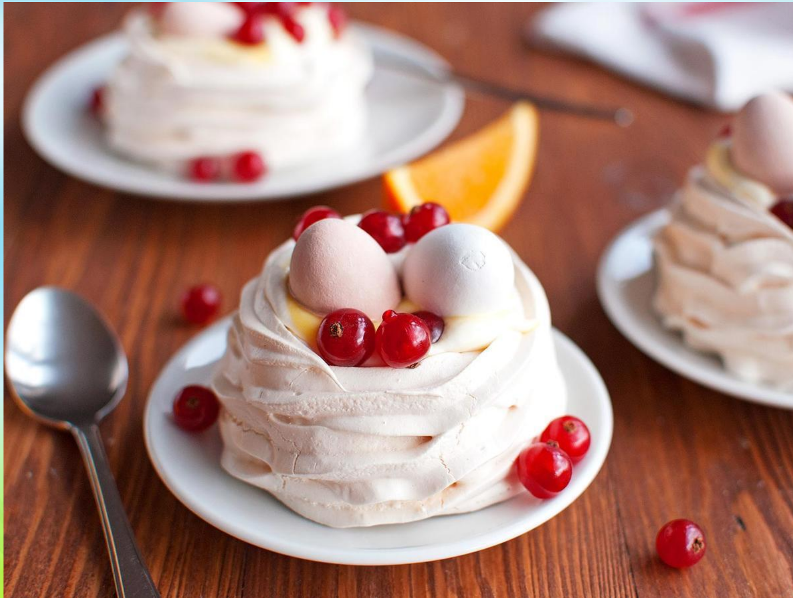
Безе, меренга — Meringue