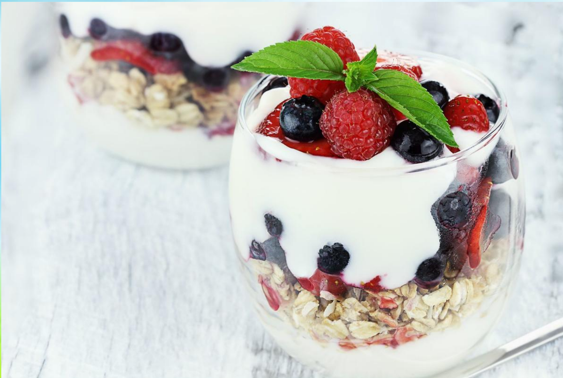
Παρφε — Parfait