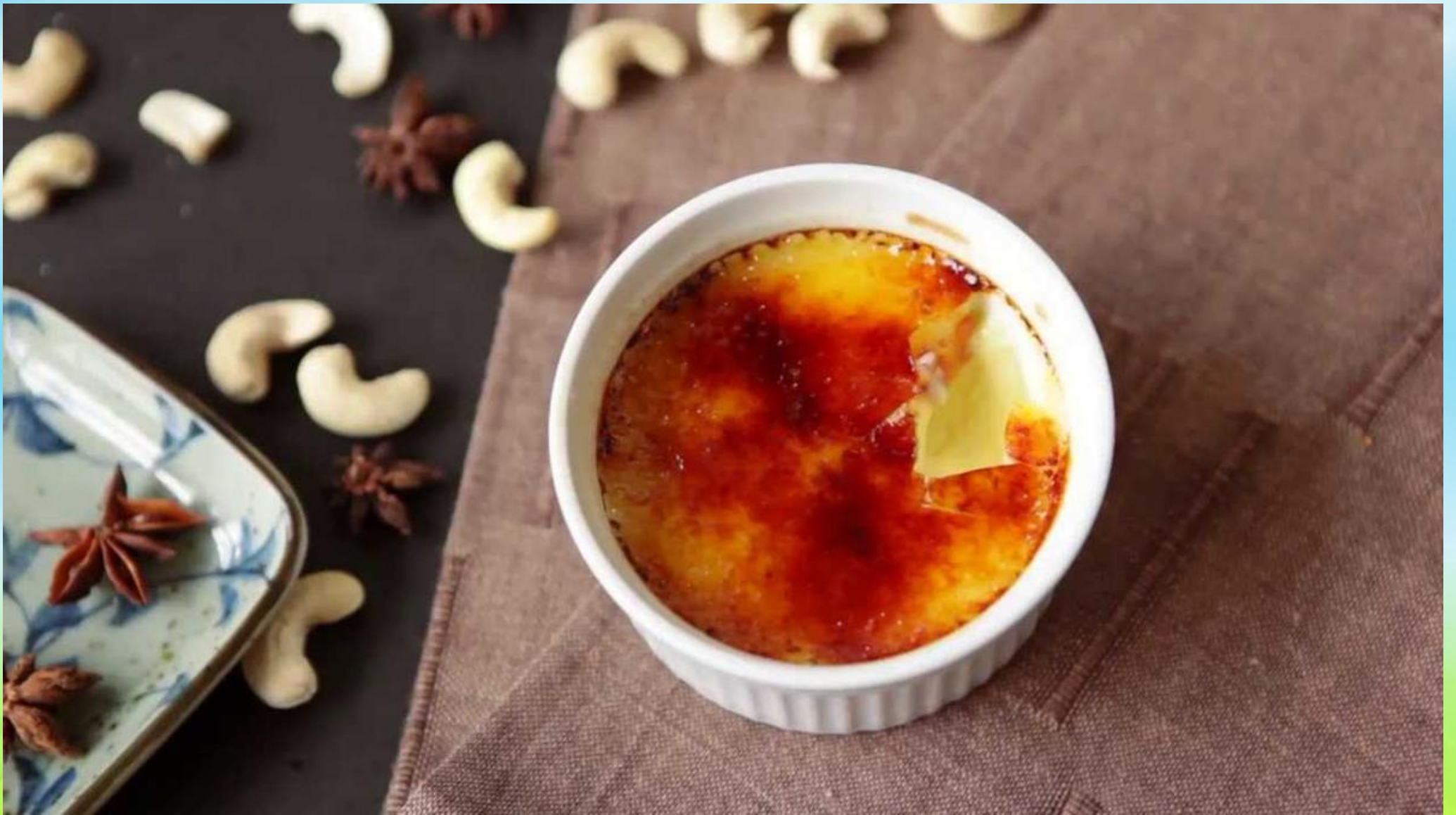
Крем-брюле — Crème brûlée