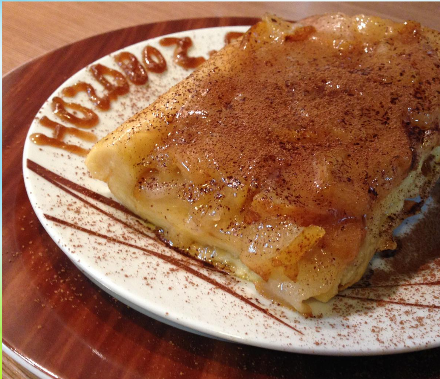
Тарт Татен — Tarte Tatin