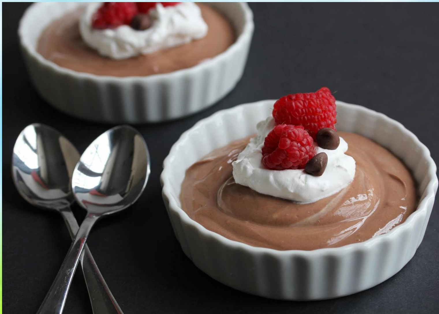
Mycc — Mousse