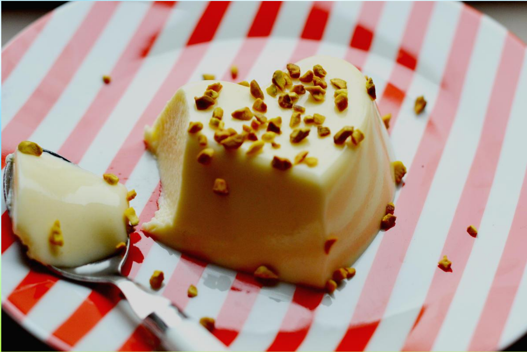
Бланманже — Blanc-manger