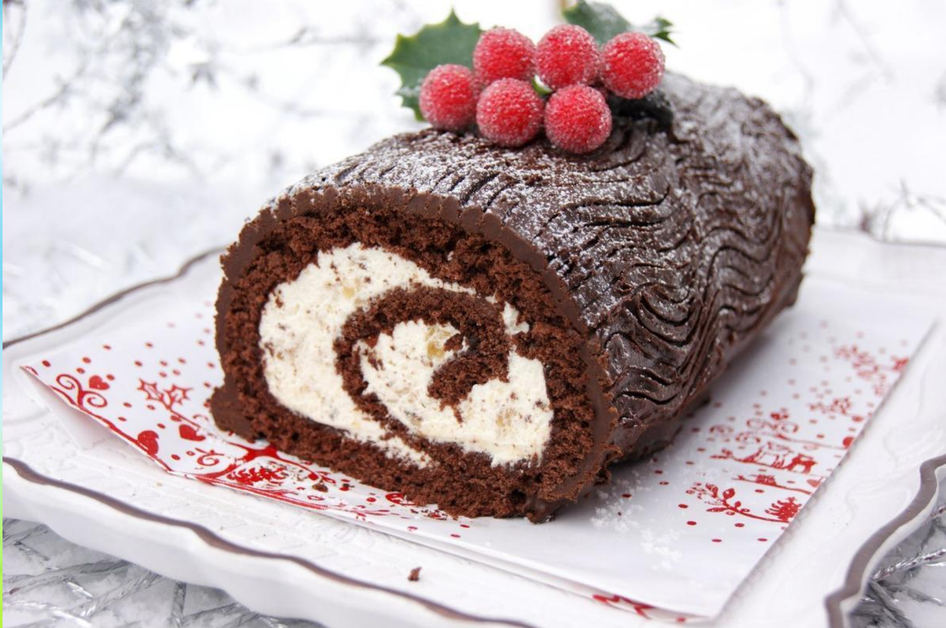
Рождественское полено — Bûche de Noël