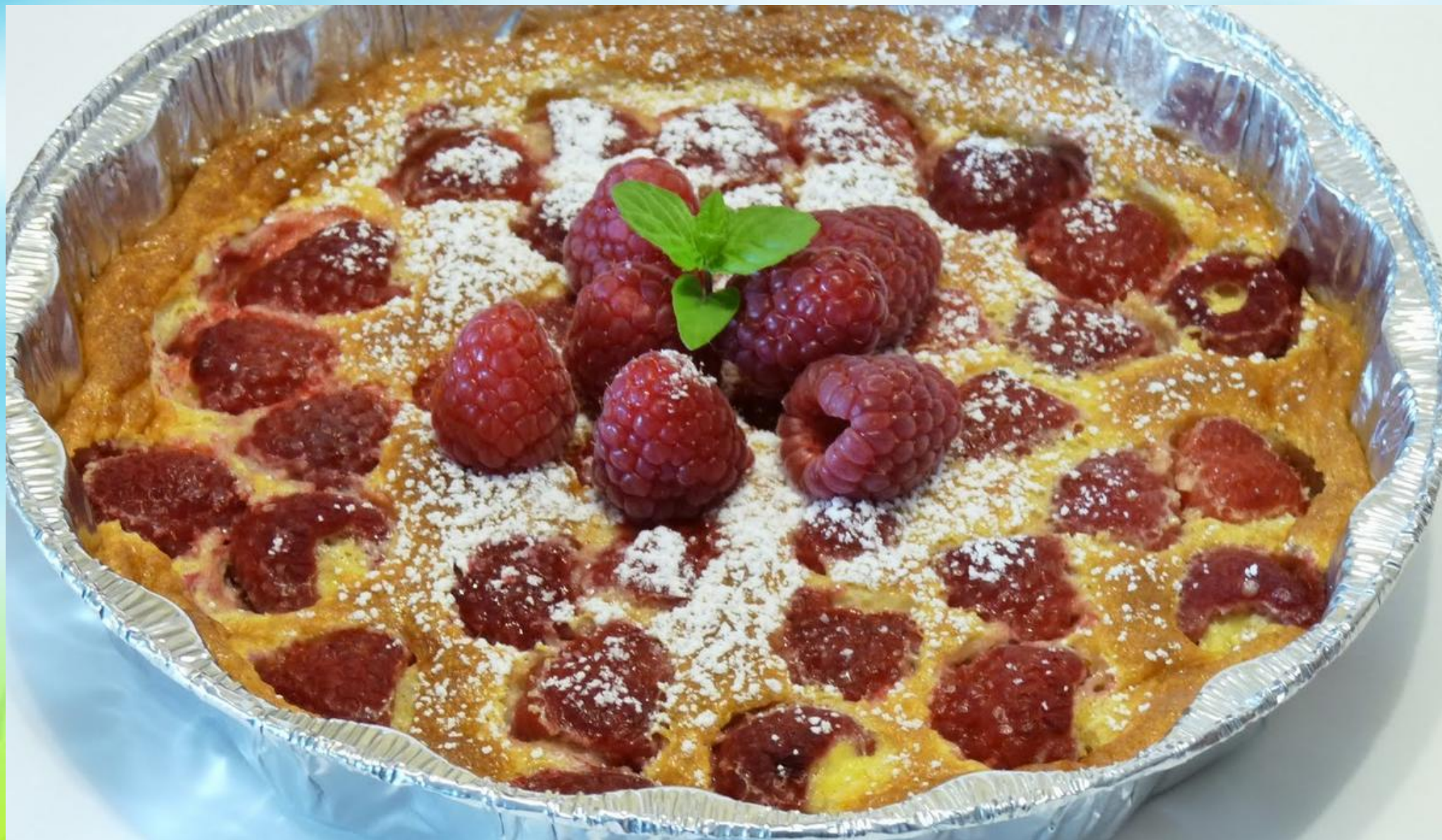
Клафути — Clafoutis