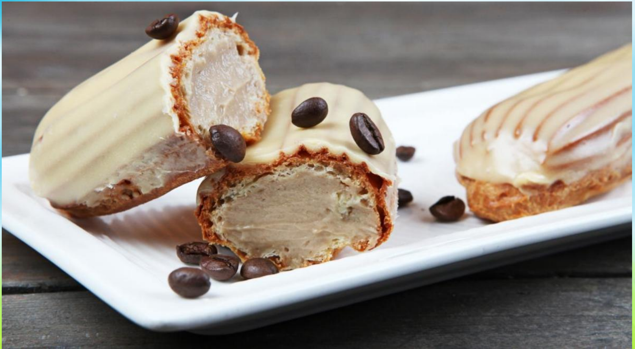
Эклер — éclair