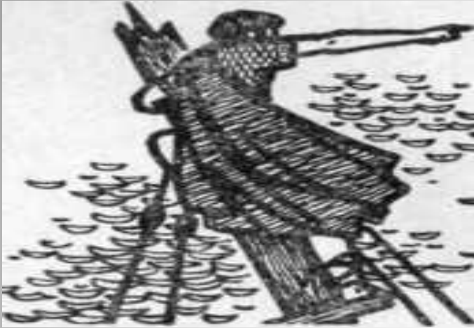
КАК ВОЗНИКЛА ЯЛТА