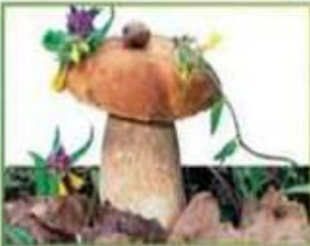
белый гриб (еловый)