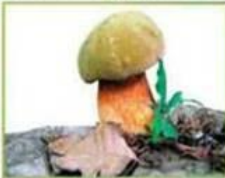
белый гриб (дубовый)