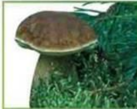
белый гриб (сосновый)