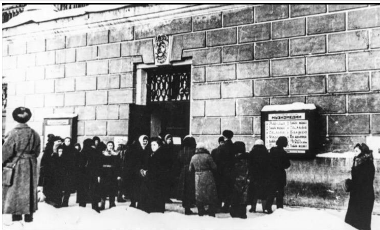
Очередь за билетами у здания Академического театра драмы имени А.С.Пушкина, в котором давали спектакль актера Музыкальной комедии. 1942 г.