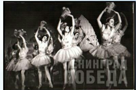
Сцена из балета «Эсмеральда», 1942 г.