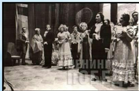
Сцена из оперы «Евгений Онегин», 1942 г.