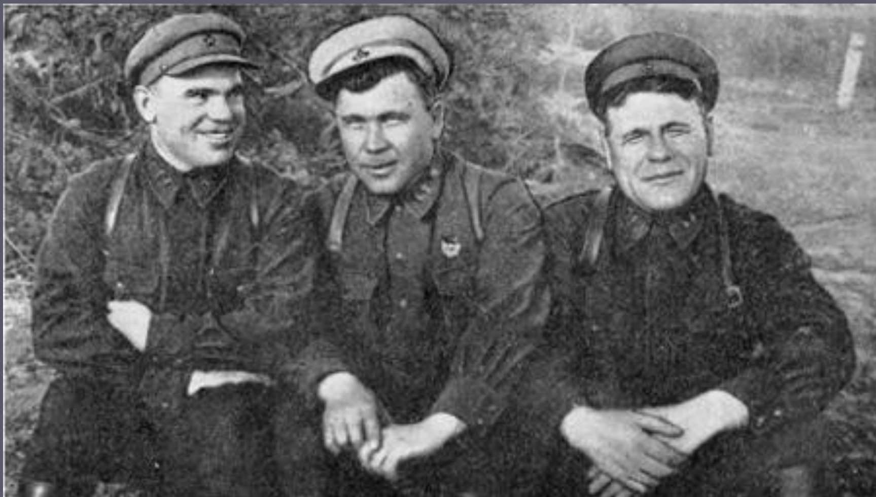
Офицеры 243-й дивизии (формировалась на территории Ярославской области). 1942 год