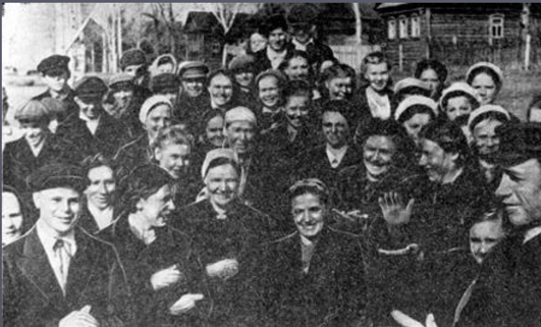
День победы в колхозе имени Сталина Ярославского района. 1945 год