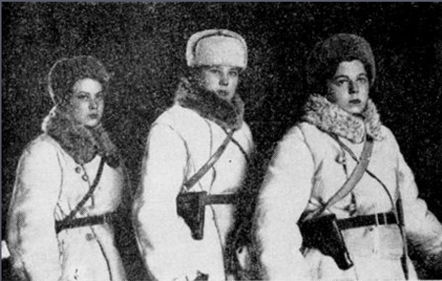
Медицинские сестры Ярославского партизанского отряда