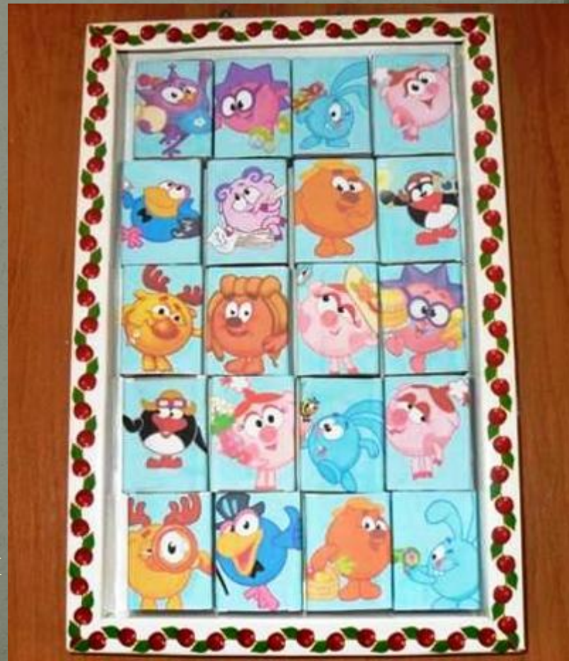
Театр на спичечных коробках