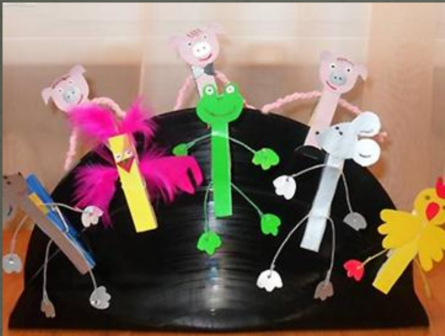
Театр на прищепках