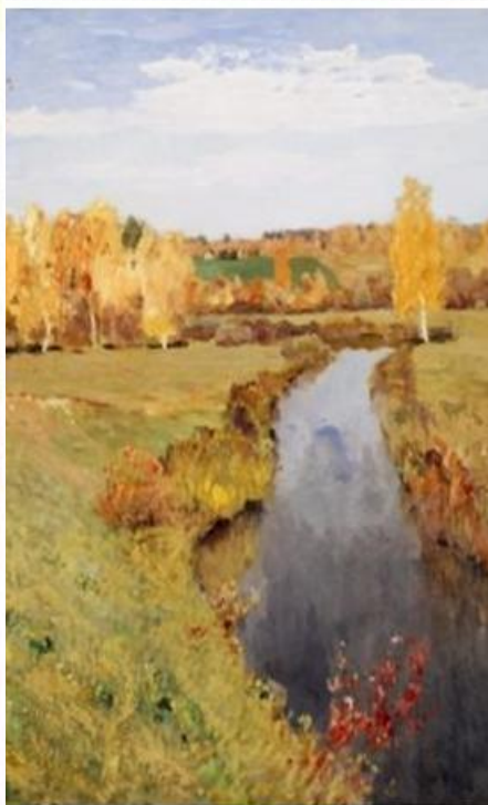
«Золотая осень» (1895) Исаак Левитан