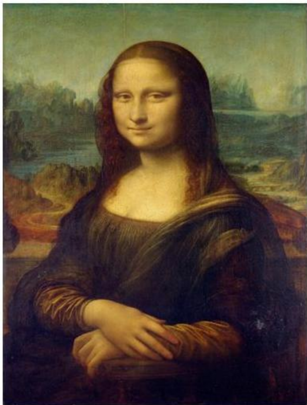
«Мона лизи» (1503-1500) Леонардо да Винчи