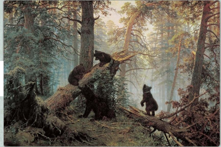
Иван Шишкин Утро в сосновом лесу. 1889