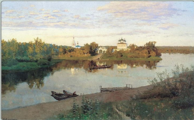
Исаак Левитан Вечерний звон. Вариант картины «Тихая обитель». 1892

Если видишь на картине нарисована река Или ель и белый иней, или сад и облака, Или снежная гавнина, или поле