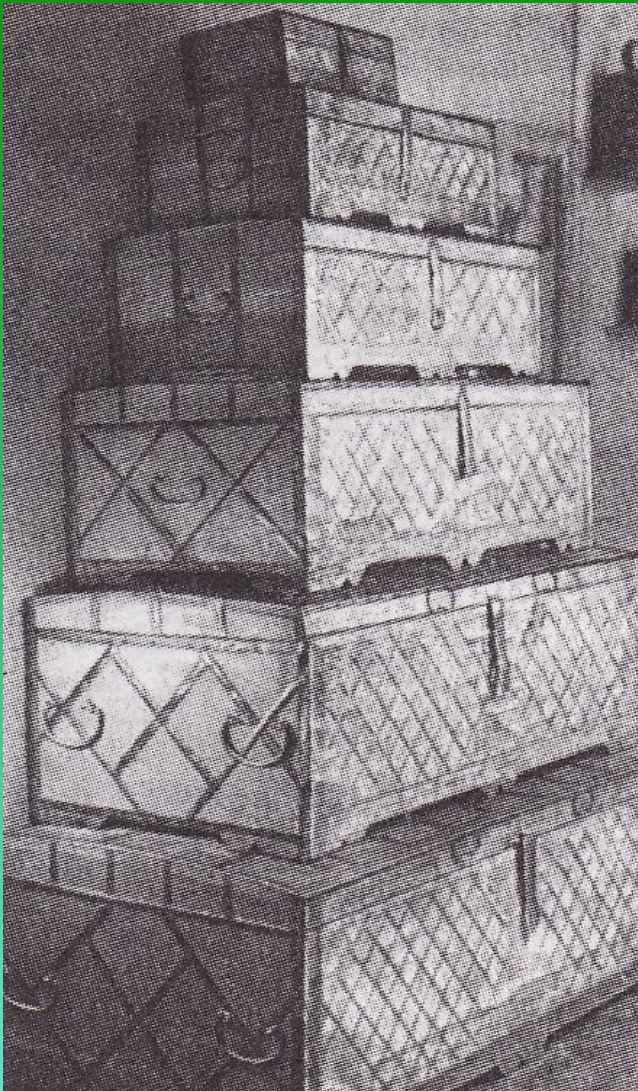
Невьянский сундучный промысел

Особенно выделялись сундучный промысел в Невьянске и производство подносов в Нижнем Тагиле.