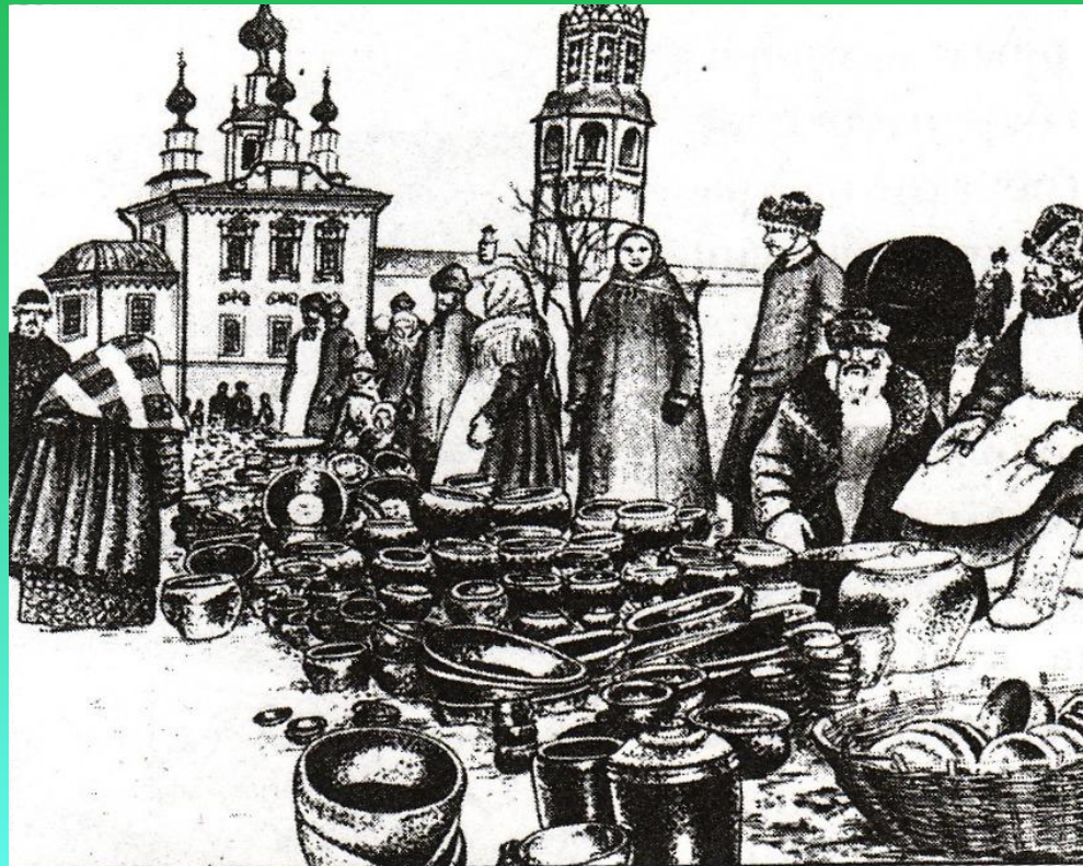
Базар в г. Кунгур.

80 % ярмарочного оборота в регионе приходилось на Ирбитскую ярмарку.