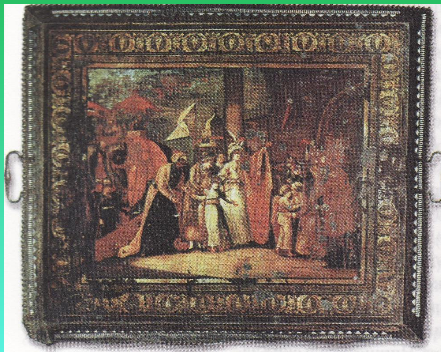
Нижнетагильский поднос. Железо, ковка, роспись масляными красками. Первая половина XIX века.