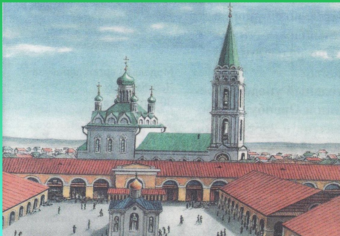
Гостиный двор в Екатеринбурге в 1810 году

Свидетельством превращения города в крупный торговый центр стала постройка Гостиного Двора в 1810 году .