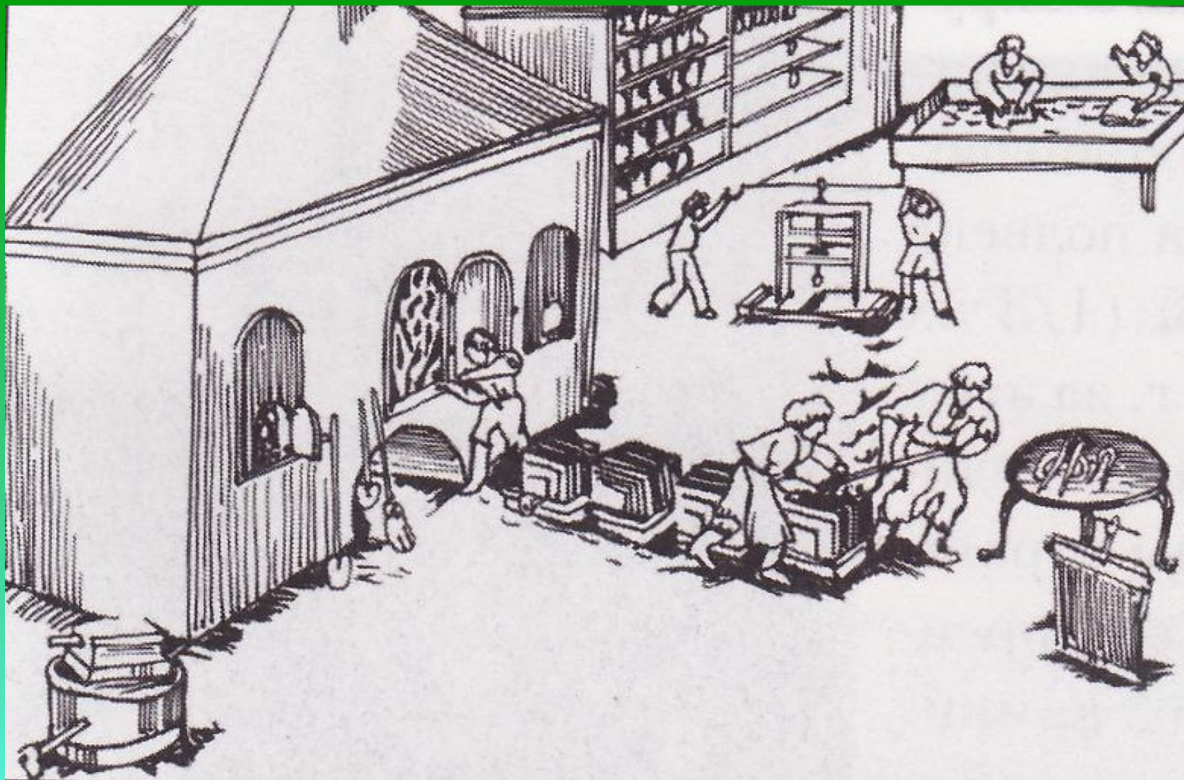
Производство холодного оружия на Златоустовской фабрике. 1827 год. Рисунок братьев Бояршиновых