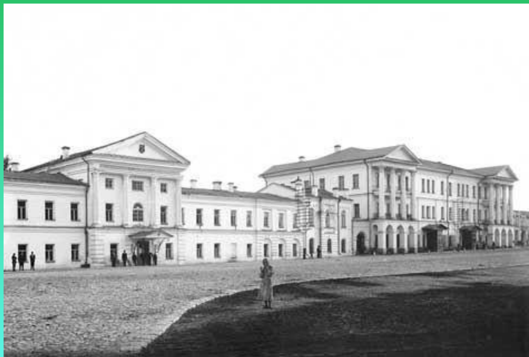
Уральское горное правление в Екатеринбурге

В 1831 году Горное правление перевели в Екатеринбург и оно стало называться Уральским горным правлением.