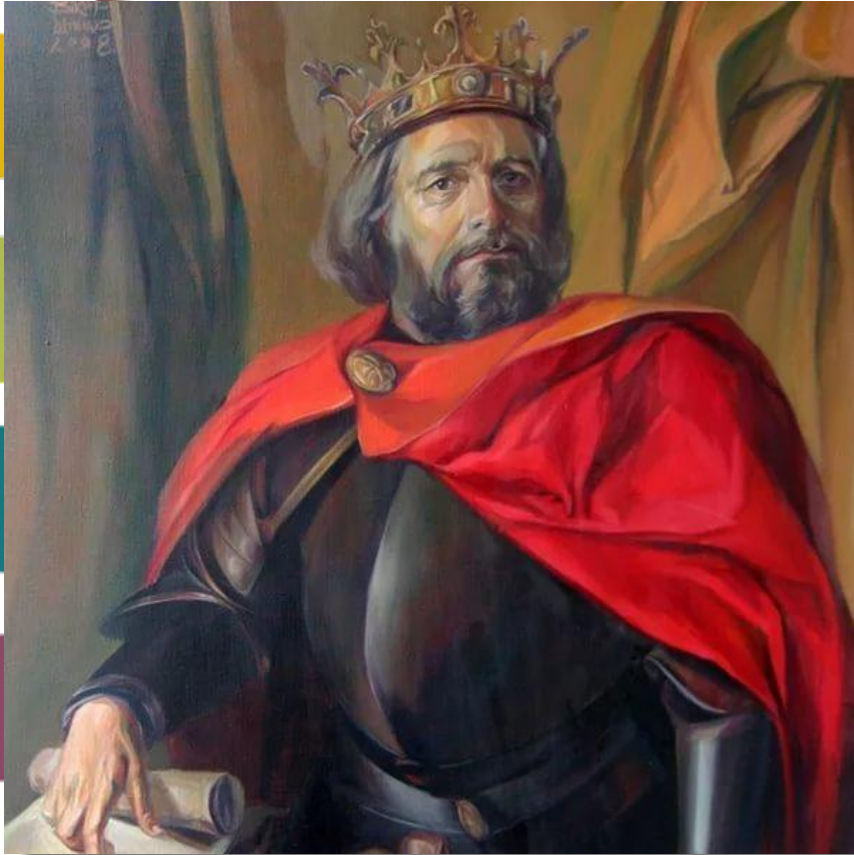
Роман Мстиславич Галицкий