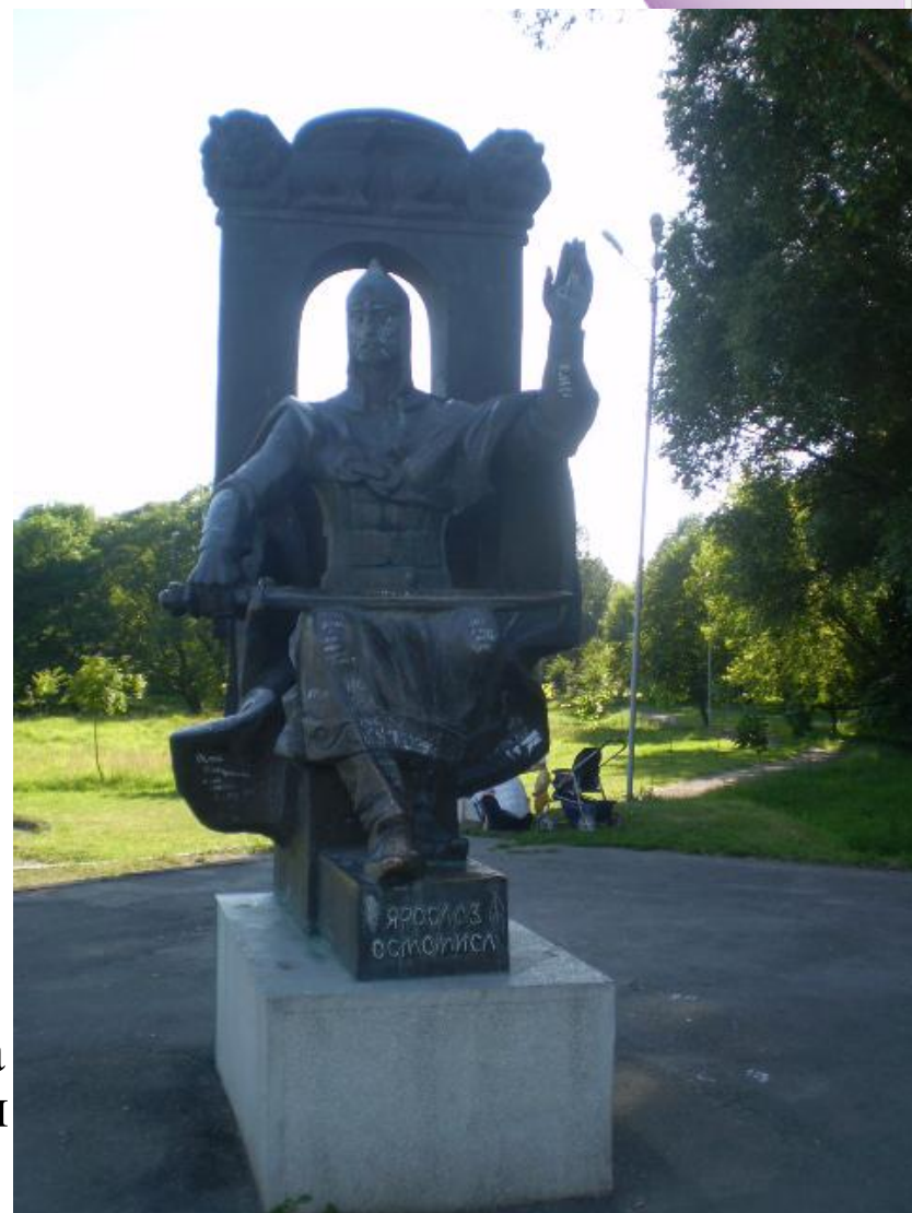
Памятник Ярославу Осмомыслу на Волыни

○ Летописцы отмечали, что в правление Ярослава Галицкая земля процветала и всем изобиловала, так как князь населил города умелыми ремесленниками, купцами, торговавшими с Византией. Его воинская сила была настолько внушительной, что враги опасались нападать на Галицкое княжество, что способствовало увеличению в нем населения.