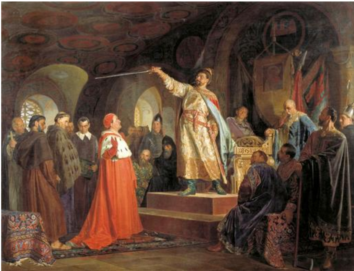
Н.В. Неврев. Роман Галицкий принимает послов папы Иннокентия III. 1875 г. Национальный художественный музей Республики Беларусь