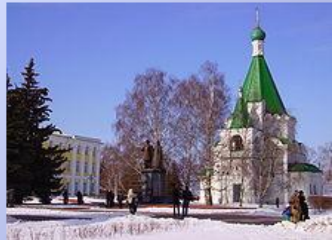
Памятник князю Юрию Всеволодовичу и епископу Симону Суздальскому у Архангельского собора в Кремле

Нижний Новгород — пятый по численности населения город России с населением 1 278 803 человек, важный экономический, транспортный и культурный центр страны. По национальному составу преобладают русские. В Нижнем Новгороде проживают также представители других национальностей — татары, украинцы, чувашаи, мордва, армяне, азербайджанцы, белорусы, грузины, евреи, марийцы, цыгане. Жители Нижнего Новгорода называются "нижегородцы".