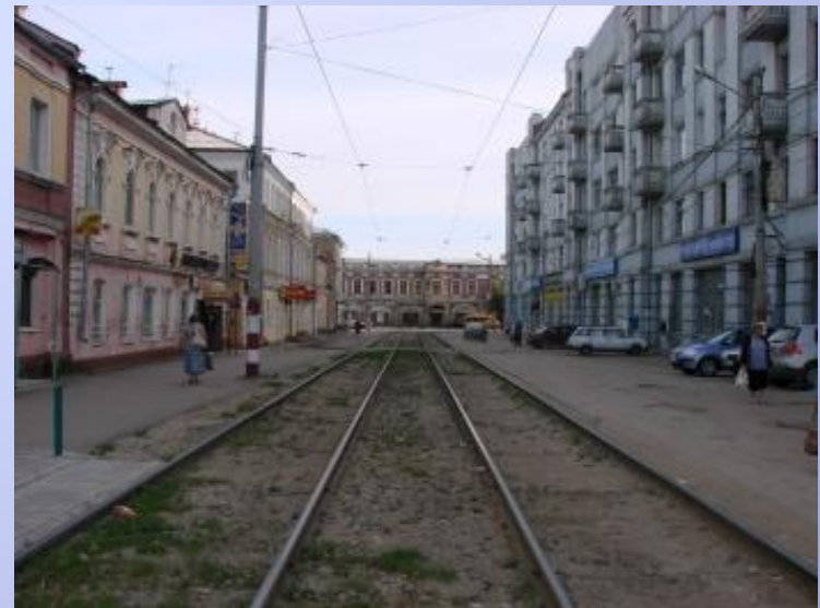
Канавинский район. Улица Канавинская