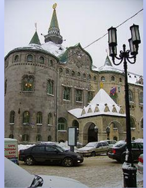
Государственный банк на Большой Покровской улице

В историческом центре города расположен каменный кремль начала XVI века — двухкилометровая кирпичная крепость с 13 сторожевыми башнями. На территории Кремля находится Михайло-Архангельский Собор, построенный в середине XVI века. Так же сохранились многочисленные памятники деревянного зодчества.