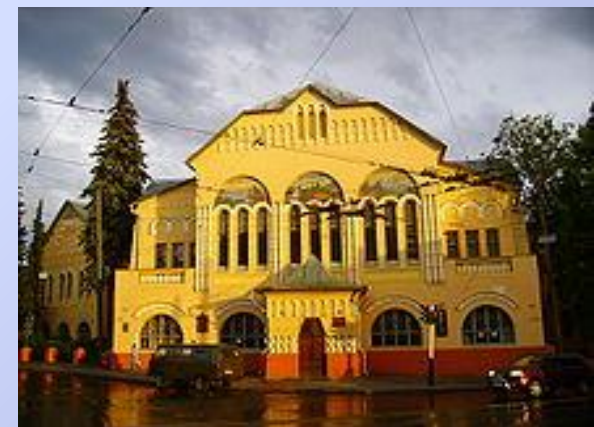
Дворец Детского творчества им. Чкалова