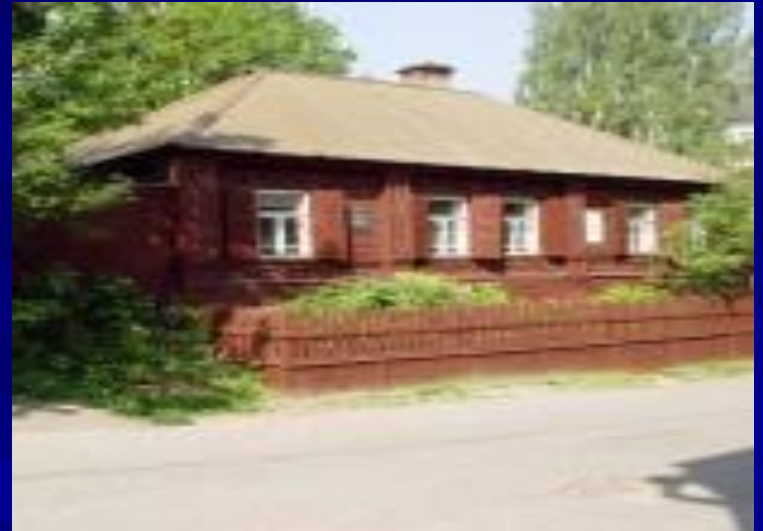
Музей детства А.М. Горького "Домик Каширина"