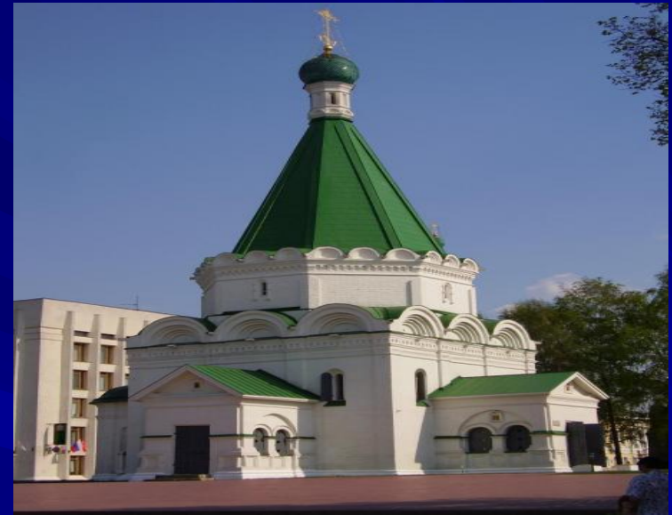
Михайло -Архангельский собор