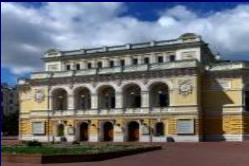
Театр драмы имени Горького