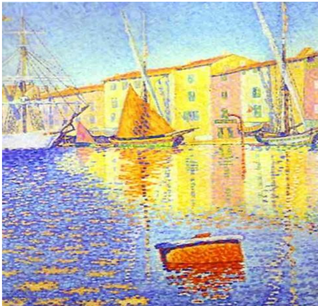
Поль Синьяк Желтый парусник