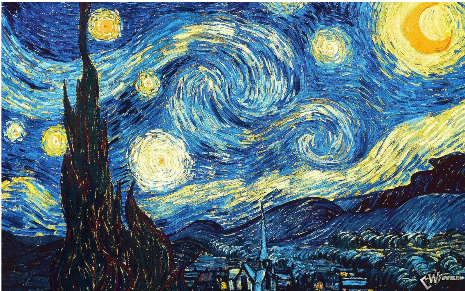
Ван Гог Звёздная ночь