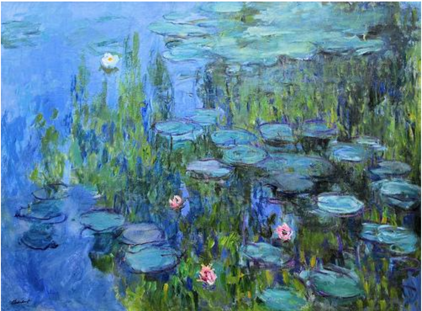
Клод Моне «Кувшинки»