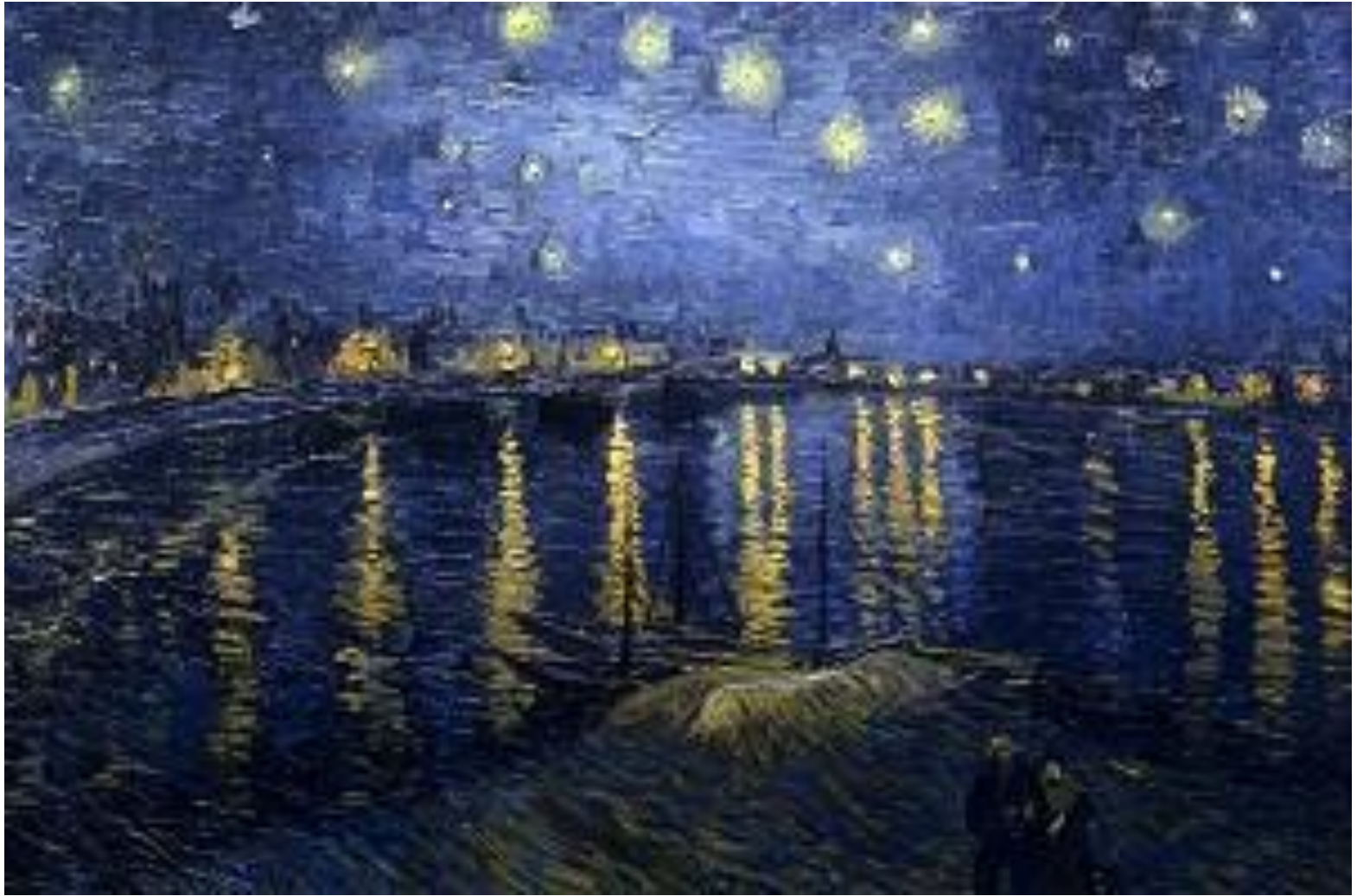
Винсент Ван Гог. Ночь над Роной 1888г