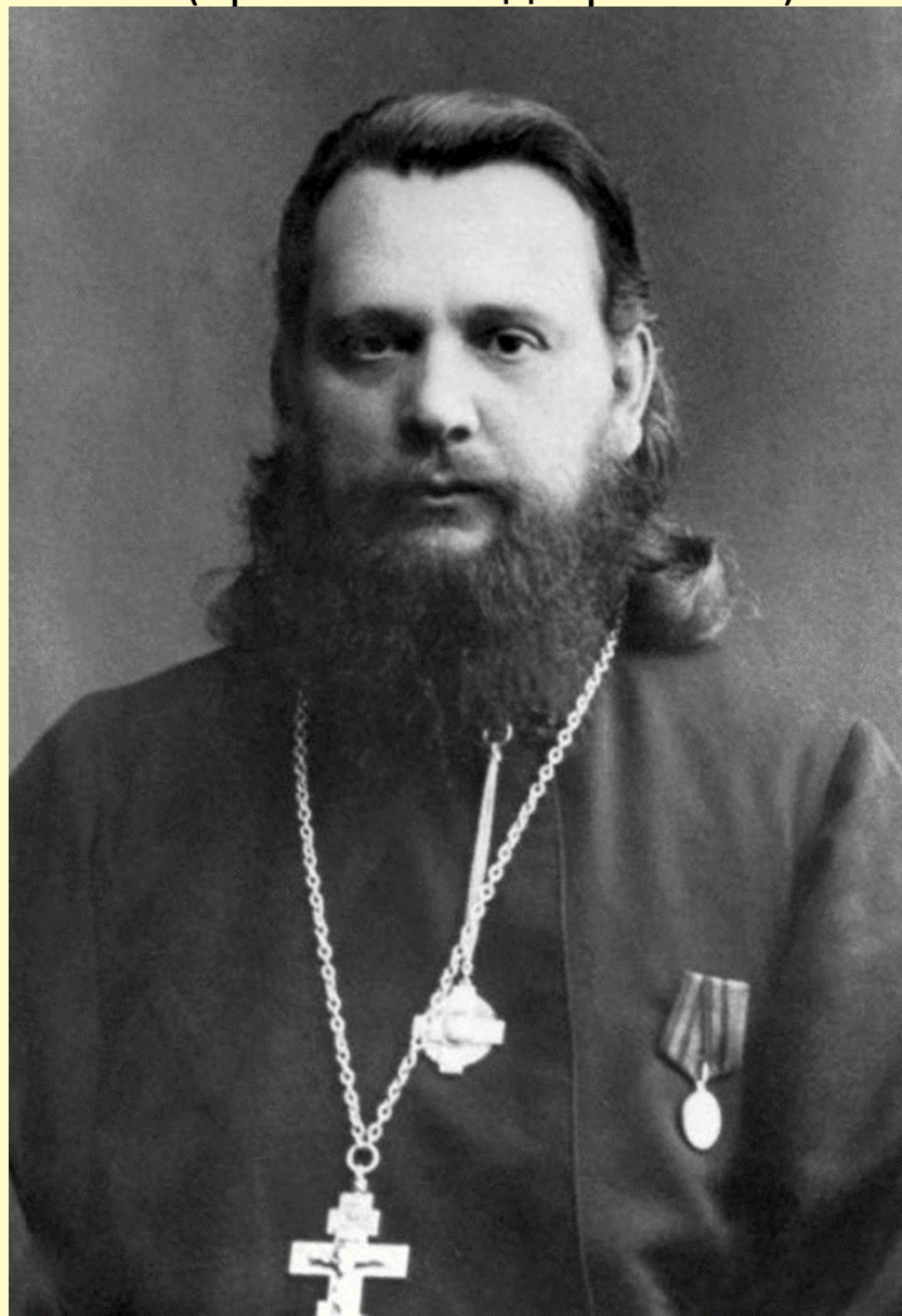
Священномученик Димитрий Павский (фото 1912 г.) (ЦГАК СПб. Ед. хр. Ж-808)