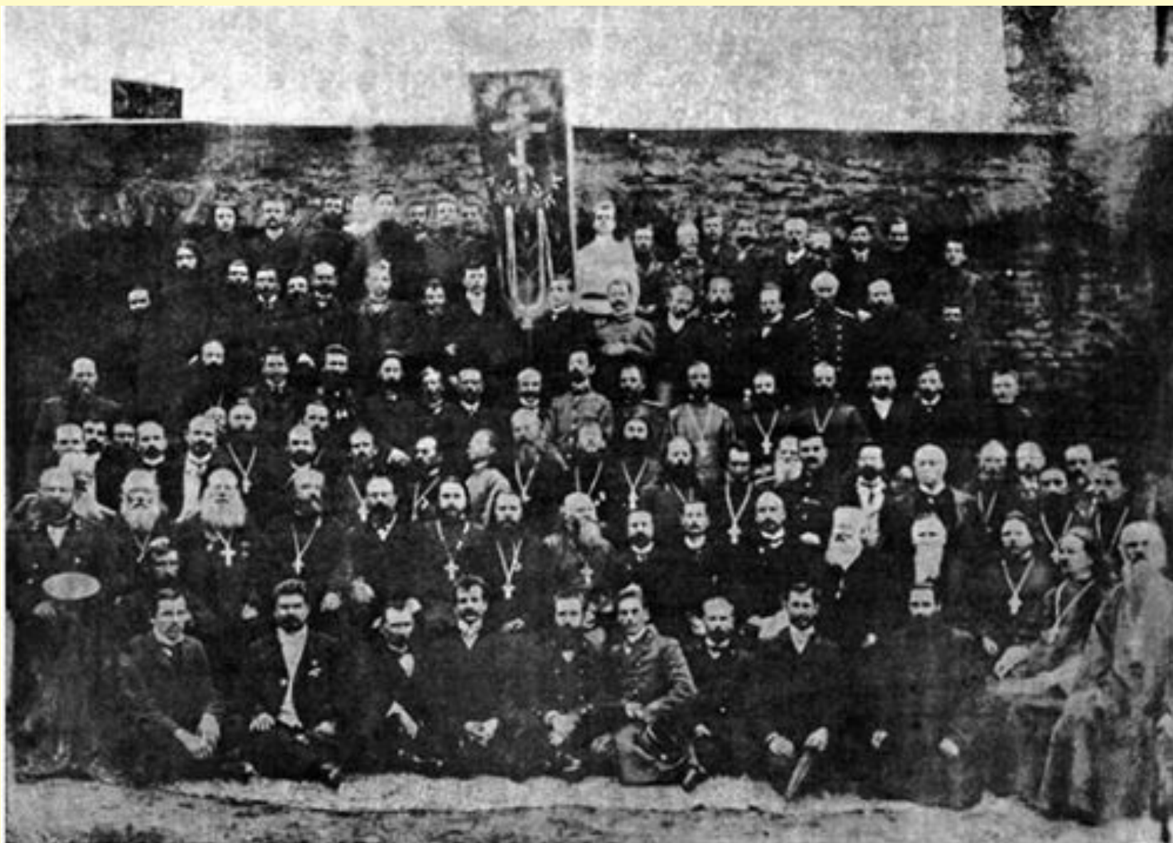
Депутаты Первого съезда представителей западнорусских братств (Минск, 29–31 августа 1908 г.)