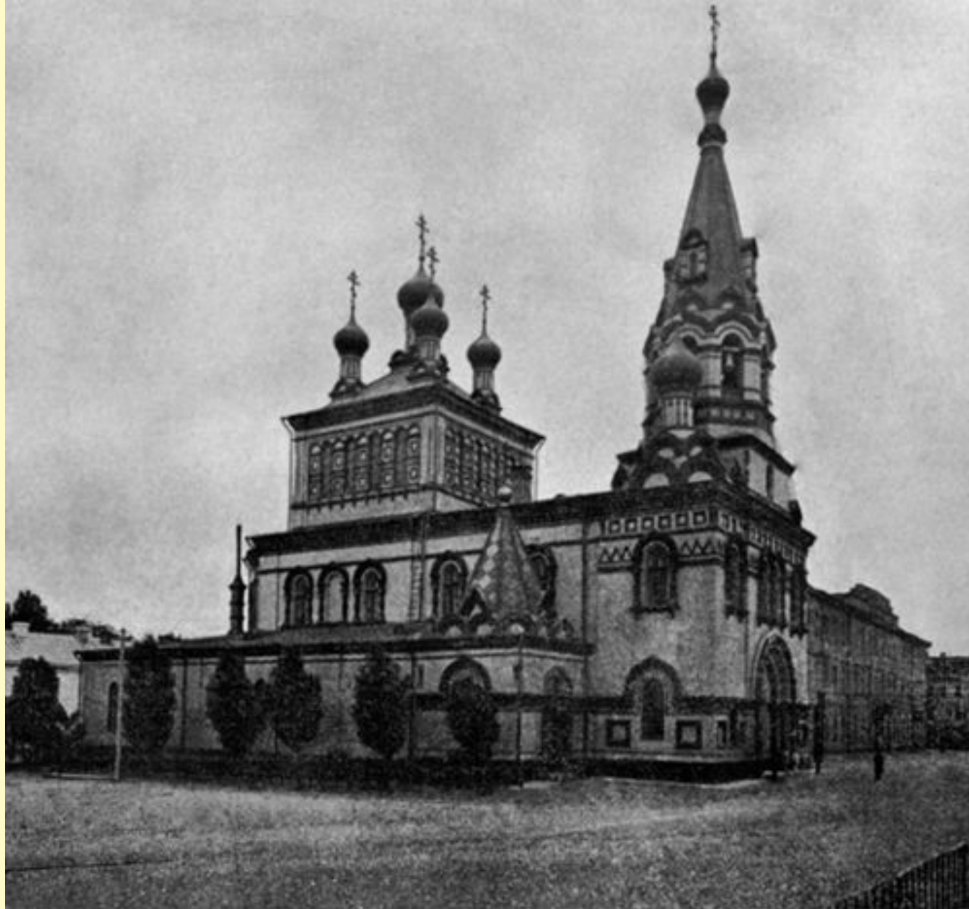
Минский кафедральный Свято-Петро-Павловский собор (ок. 1904 г.)