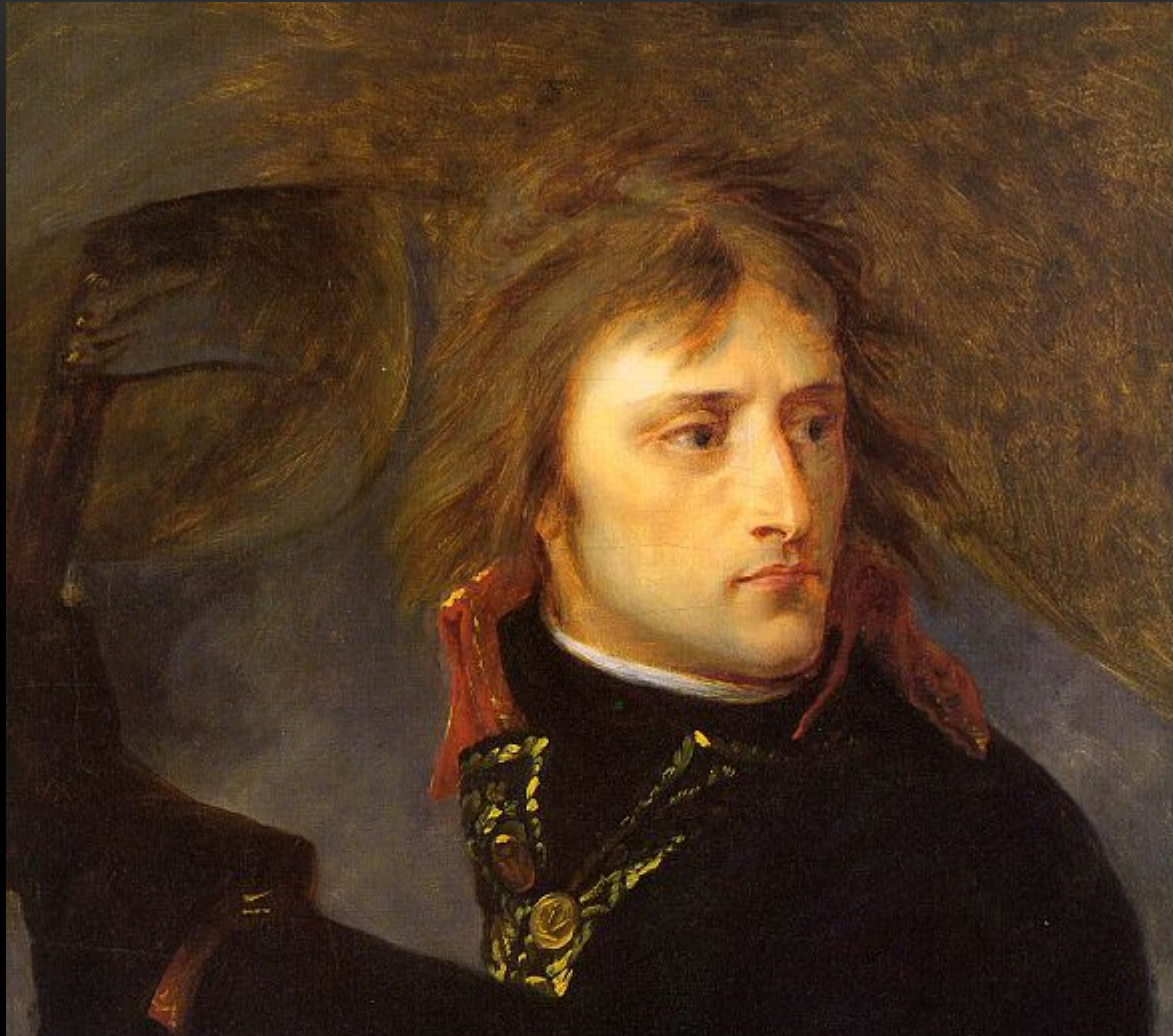
БОНАПАРТ - ПОЛКОВОДЕЦ