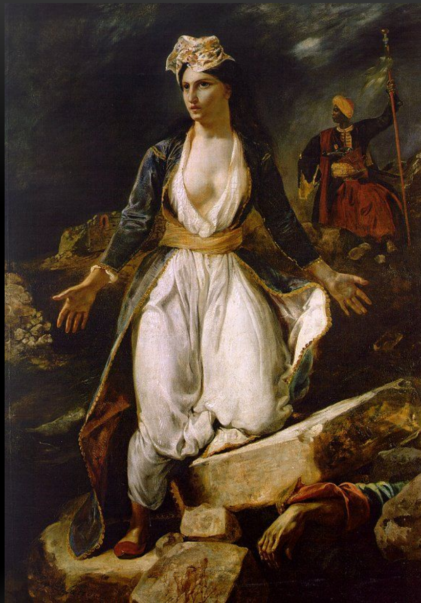
Эжен Делакруа Греция на развалинах Миссолунги