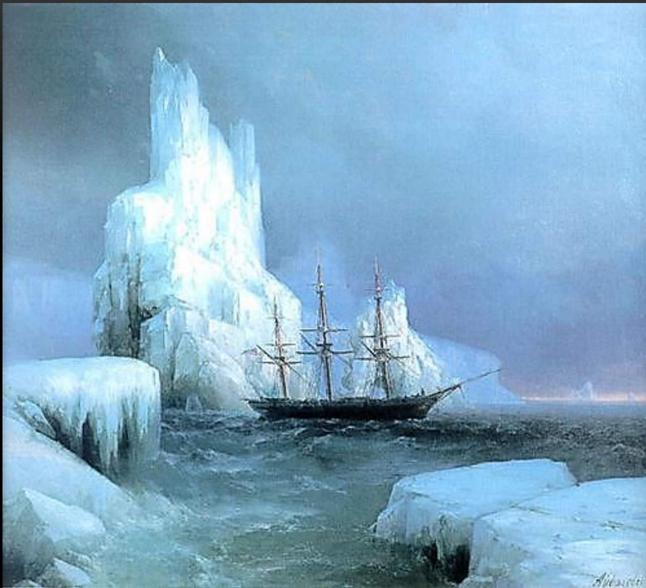
ИВАН АЙВАЗОВСКИЙ ЛЕДЯНЫЕ ГОРЫ