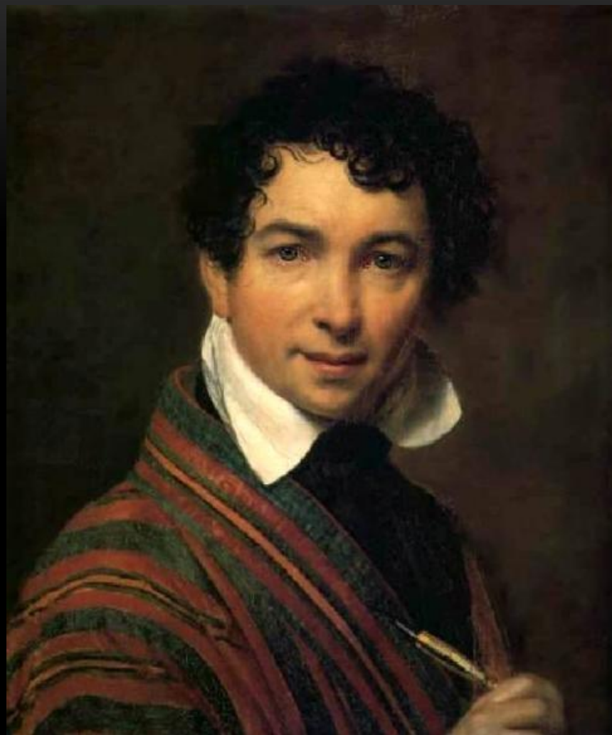
КИПРЕНСКИЙ - ХУДОЖНИК