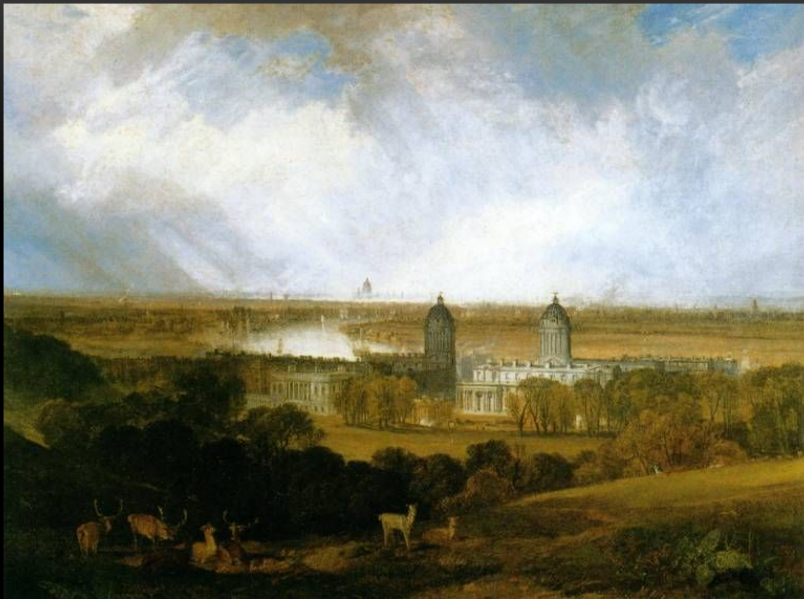
УИЛЪЯМ ТЁРНЕР ЛОНДОН