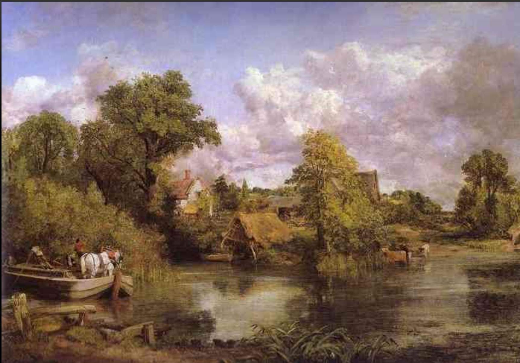
Джон Констебль Сельский пейзаж