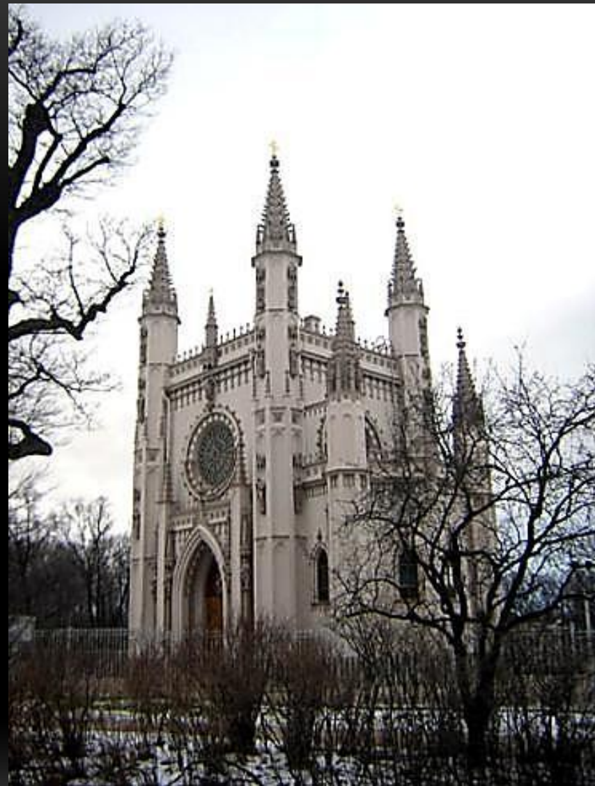
ГОТИЧЕСКАЯ КАПЕЛЛА. ПАРК АЛЕКСАНДРИЯ. ПЕТЕРГОФ АРХИТЕКТОР: КАРЛ ШИНКЕЛЬ