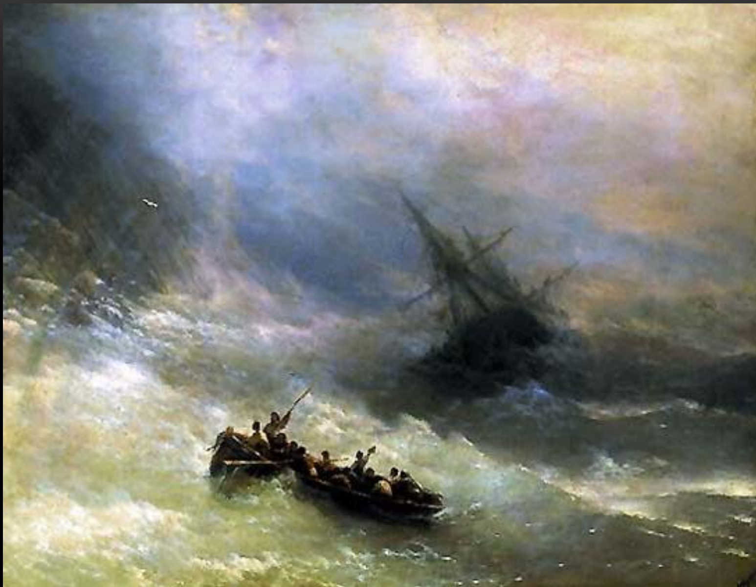
ИВАН АЙВАЗОВСКИЙ РАДУГА