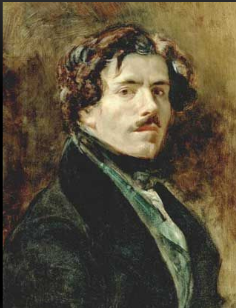
ЭЖЕН ДЕЛАКРУА - ХУДОЖНИК