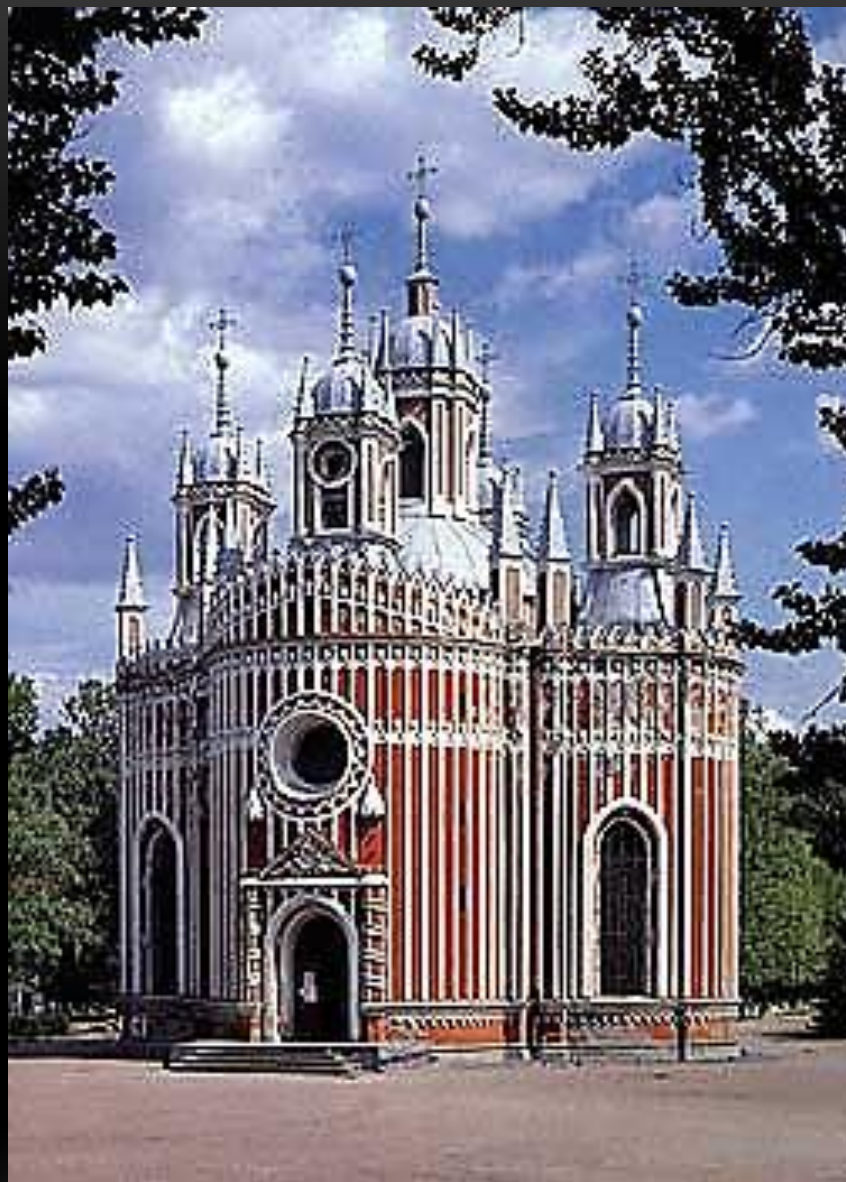
ЧЕСМЕНСКАЯ ЦЕРКОВЬ В ПЕТЕРБУРГЕ АРХИТЕКТОР: ЮРИЙ ФЕЛЬТЕН