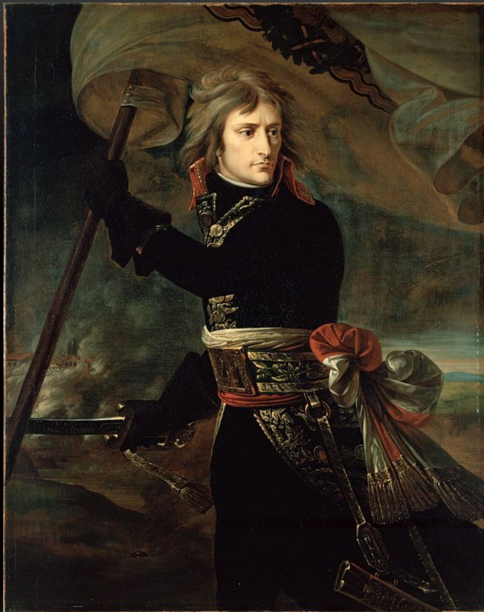
АНТУАН ГРО НАПОЛЕОН НА АРКОЛЬСКОМ МОСТУ