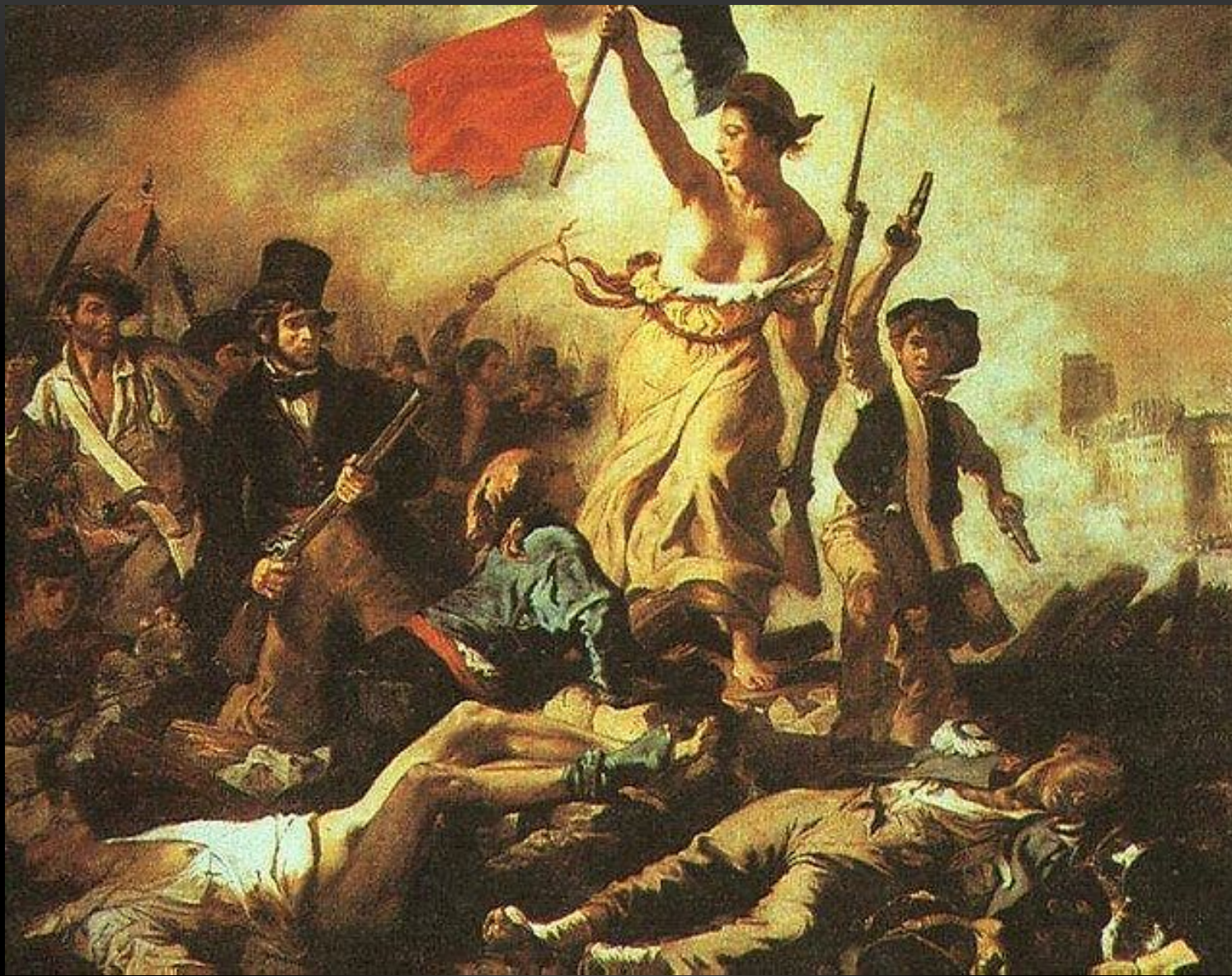
ЭЖЕН ДЕЛАКРУА СВОБОДА, ВЕДУЩАЯ НАРОД