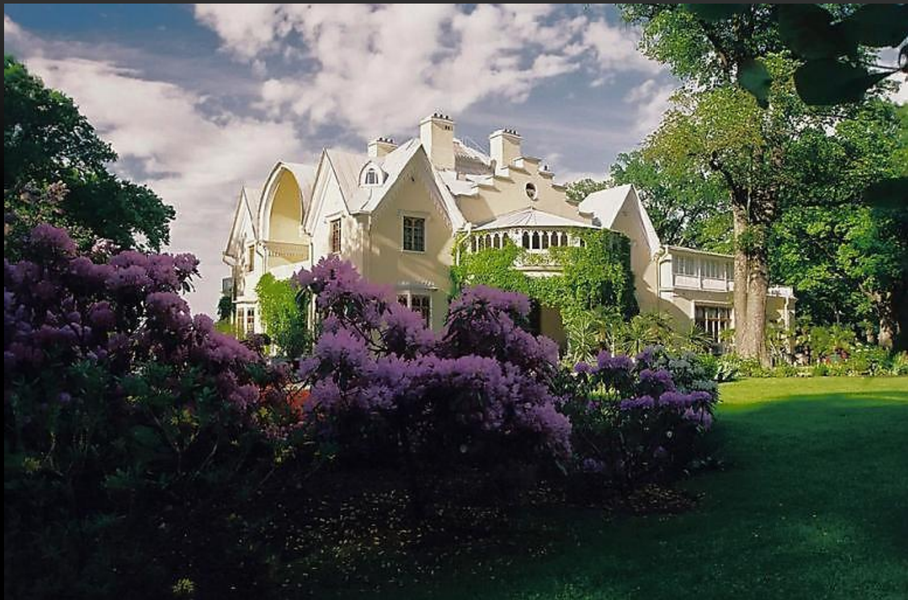
КОТТЕДЖ В ПЕТЕРГОФЕ АРХИТЕКТОР: АДАМ МЕНЕЛАС