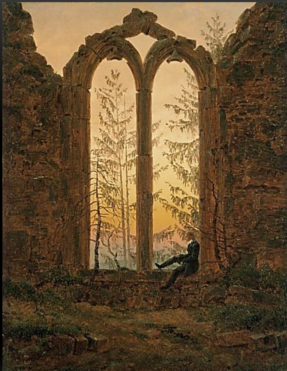
КАСПАР ФРИДРИХ РУИНЫ МОНАСТЫРЯ