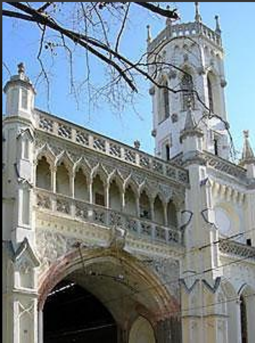
ВОКЗАЛ В ПЕТЕРГОФЕ АРХИТЕКТОР НИКОЛАЙ БЕНУА