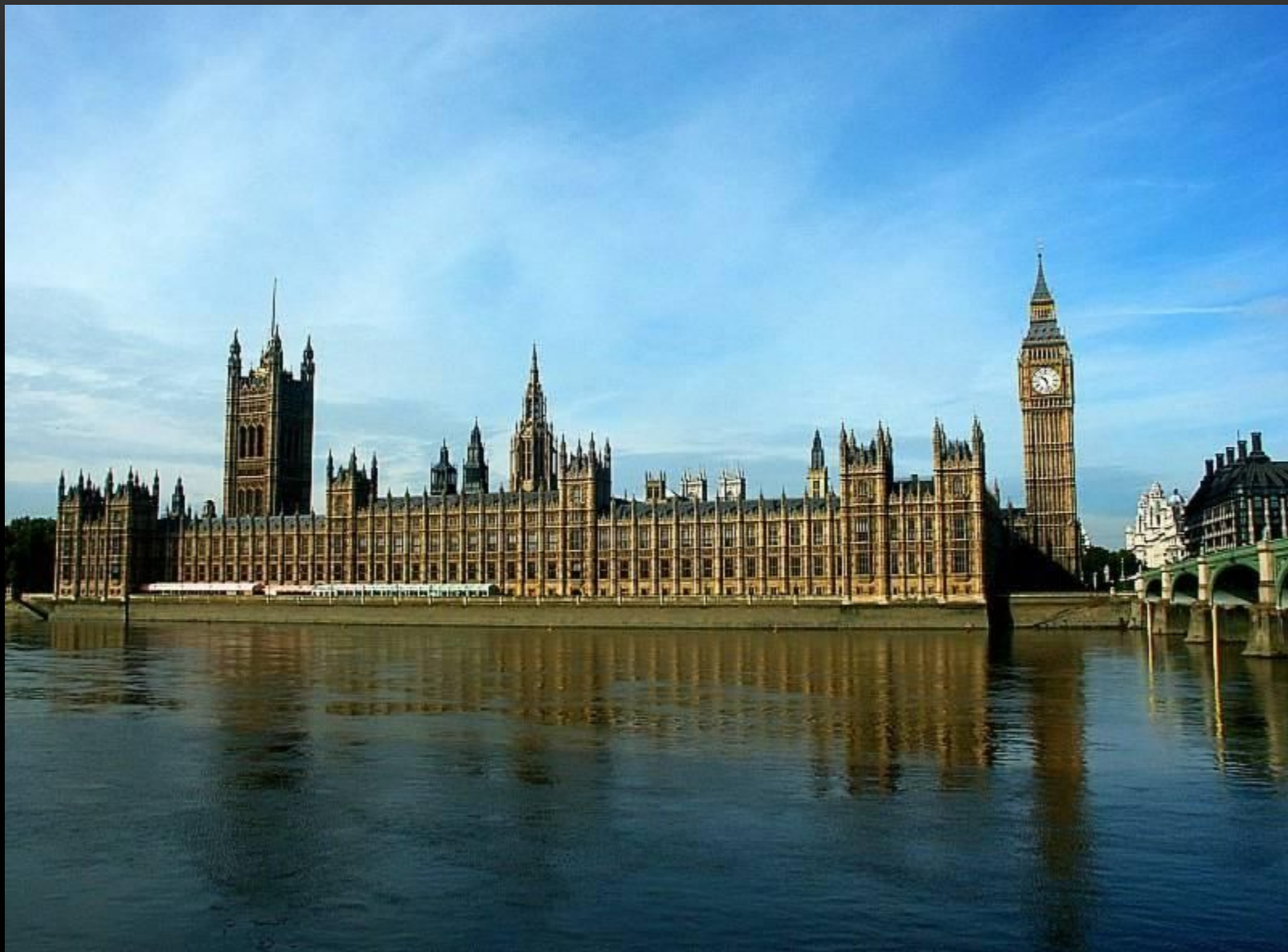
БРИТАНСКИЙ ПАРЛАМЕНТ АРХИТЕКТОР: ЧАРЛЬЗ БЭРРИ