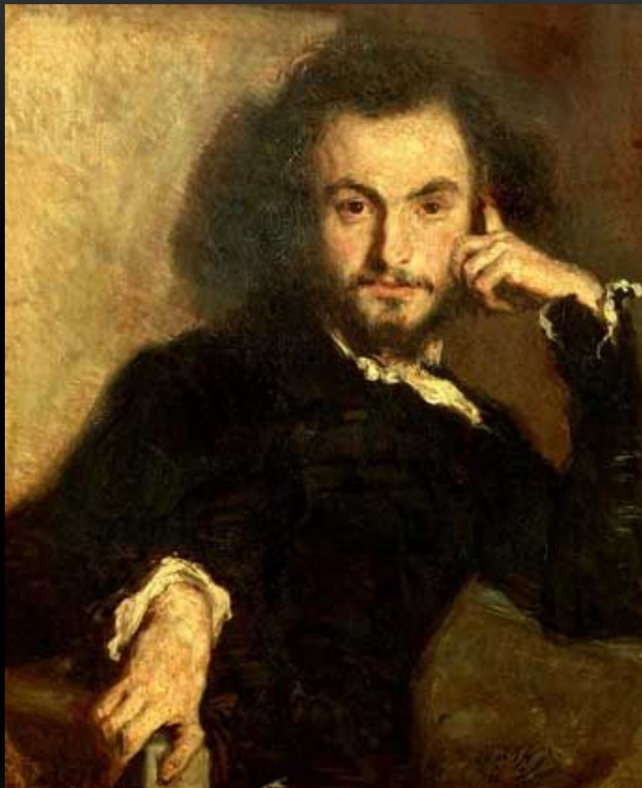
ШАРЛЬ БОДЛЕР - ПОЭТ