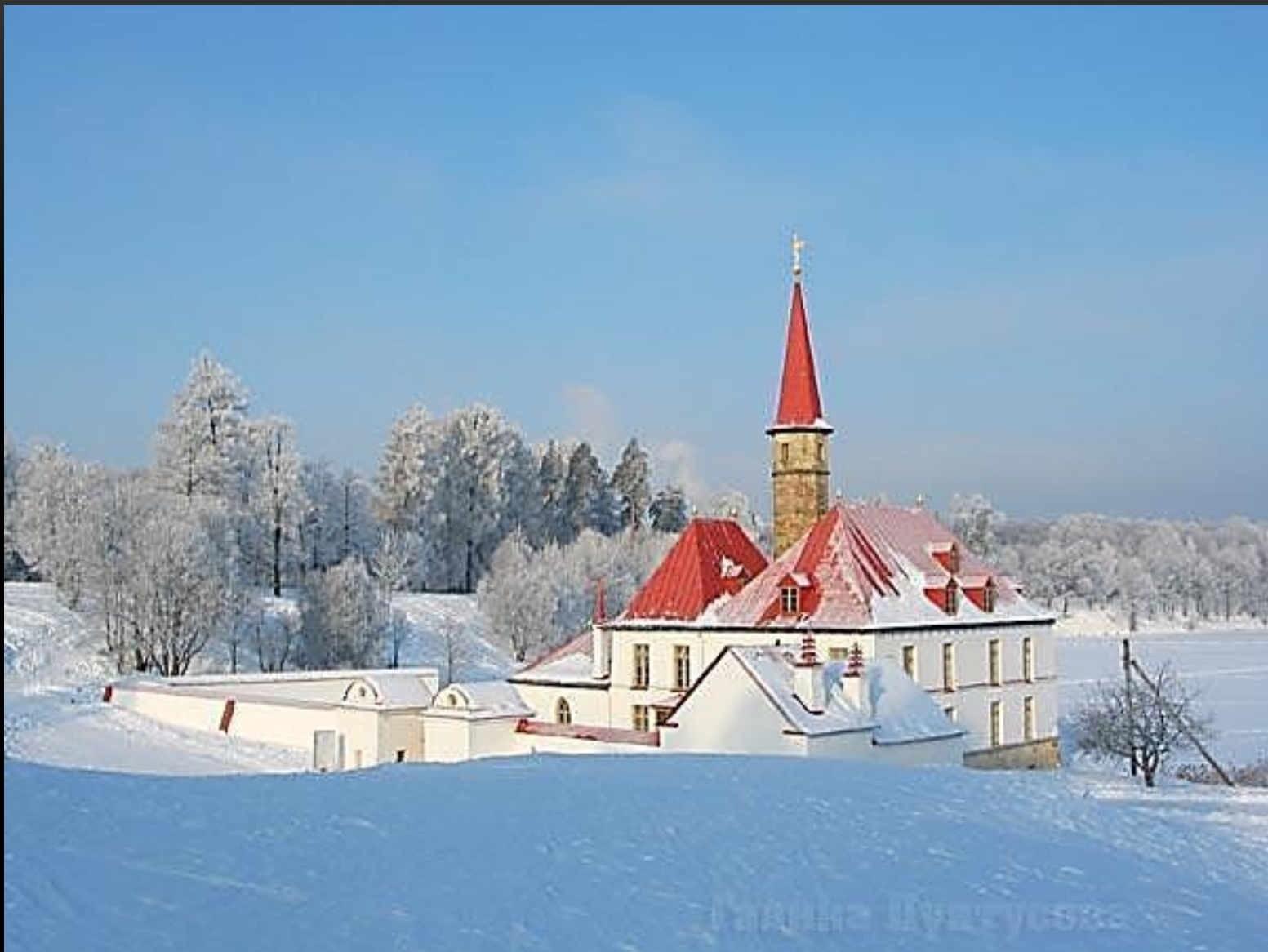
ОКРЕСТНОСТИ ГАТЧИНЫ - ПРИОРАТСКИЙ ДВОРЕЦ АРХИТЕКТОР : НИКОЛАЙ ЛЬВОВ