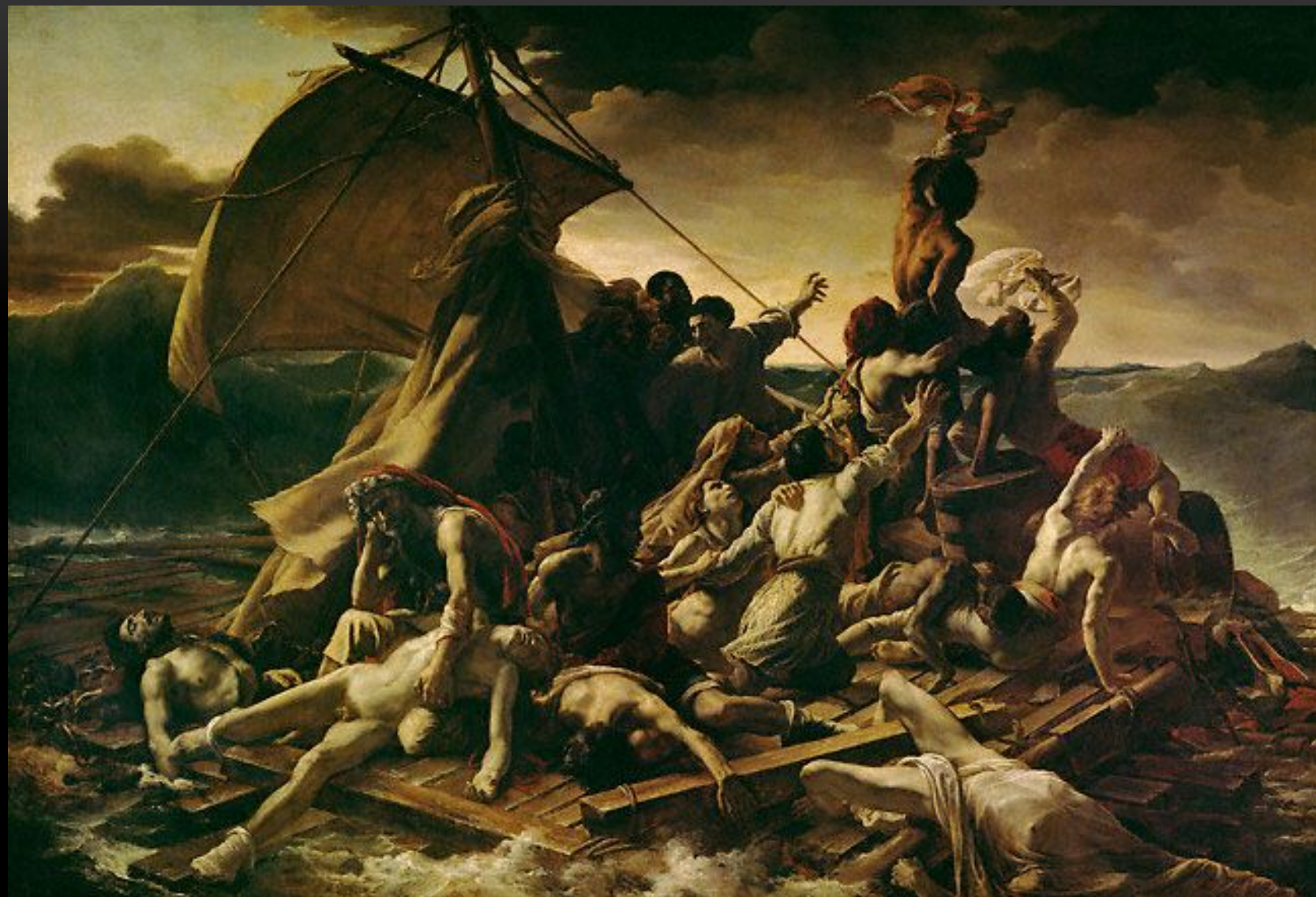
ТЕОДОР ЖЕРИКО ПЛОТ «МЕДУЗЫ»