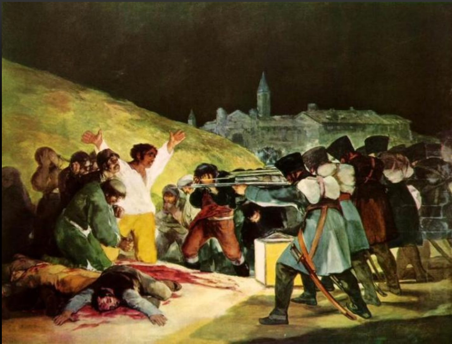
ФРАНСИСКО ГОЙЯ РАССТРЕЛ ПОВСТАНЦЕВ