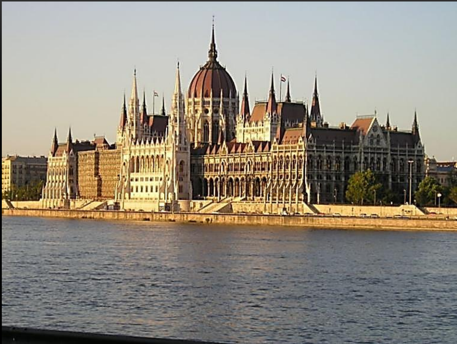
ПАРЛАМЕНТ В БУДАПЕШТЕ АРХИТЕКТОР ИМРЕ ШТАЙНДЛЬ