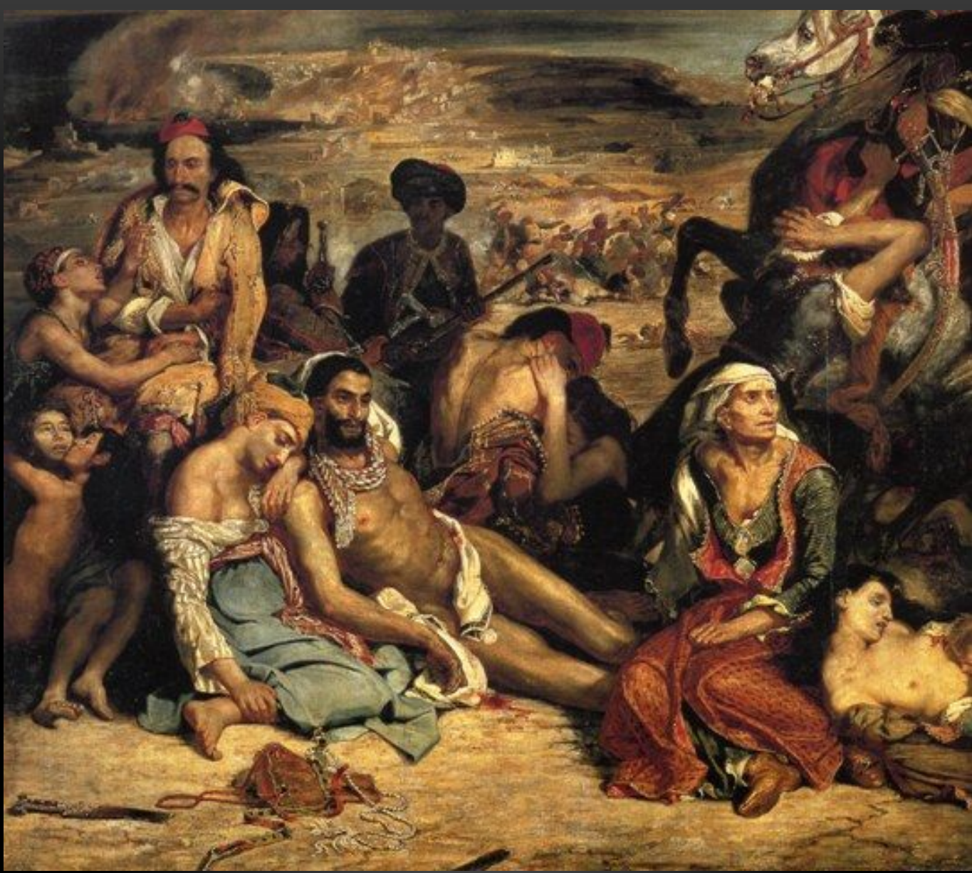
ЭЖЕН ДЕЛАКРУА РЕЗНЯ НА ХИОСЕ