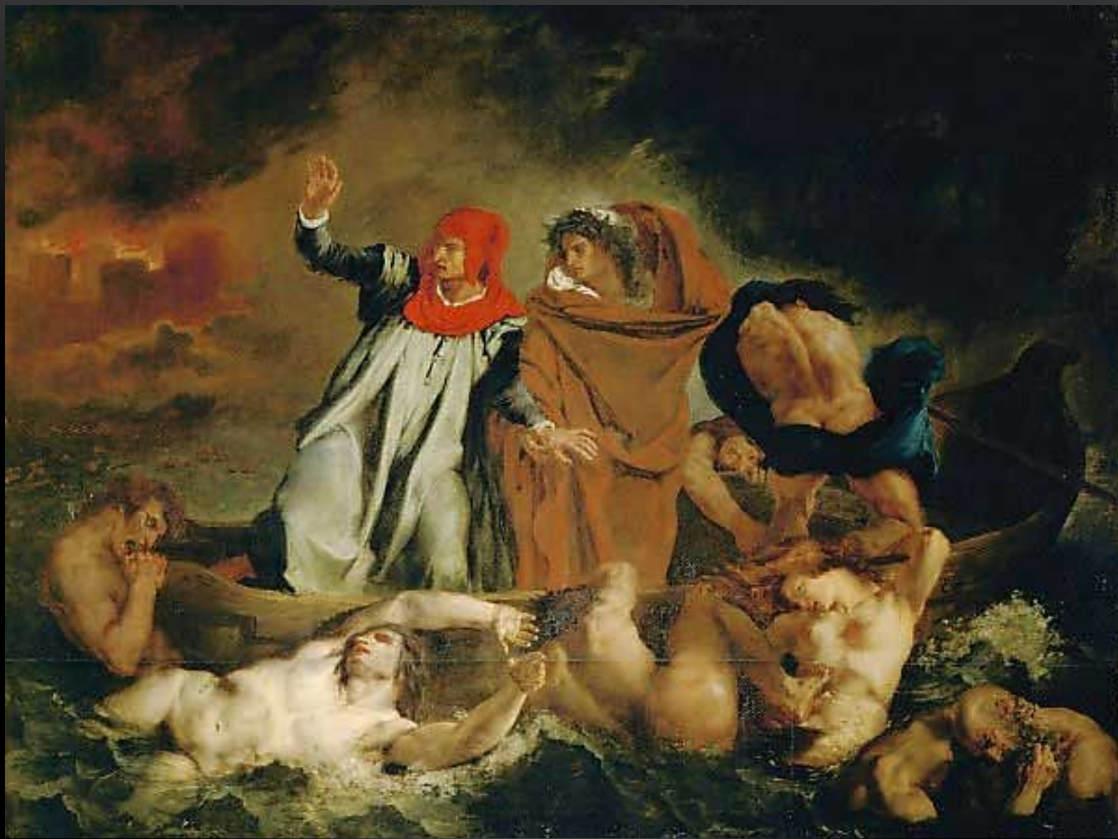
ЭЖЕН ДЕЛАКРУА ЛОДКА ДАНТЕ