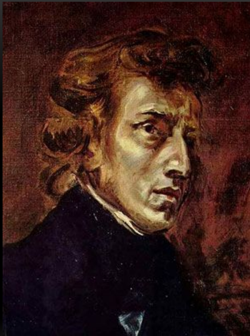
ШОПЕН - КОМПОЗИТОР