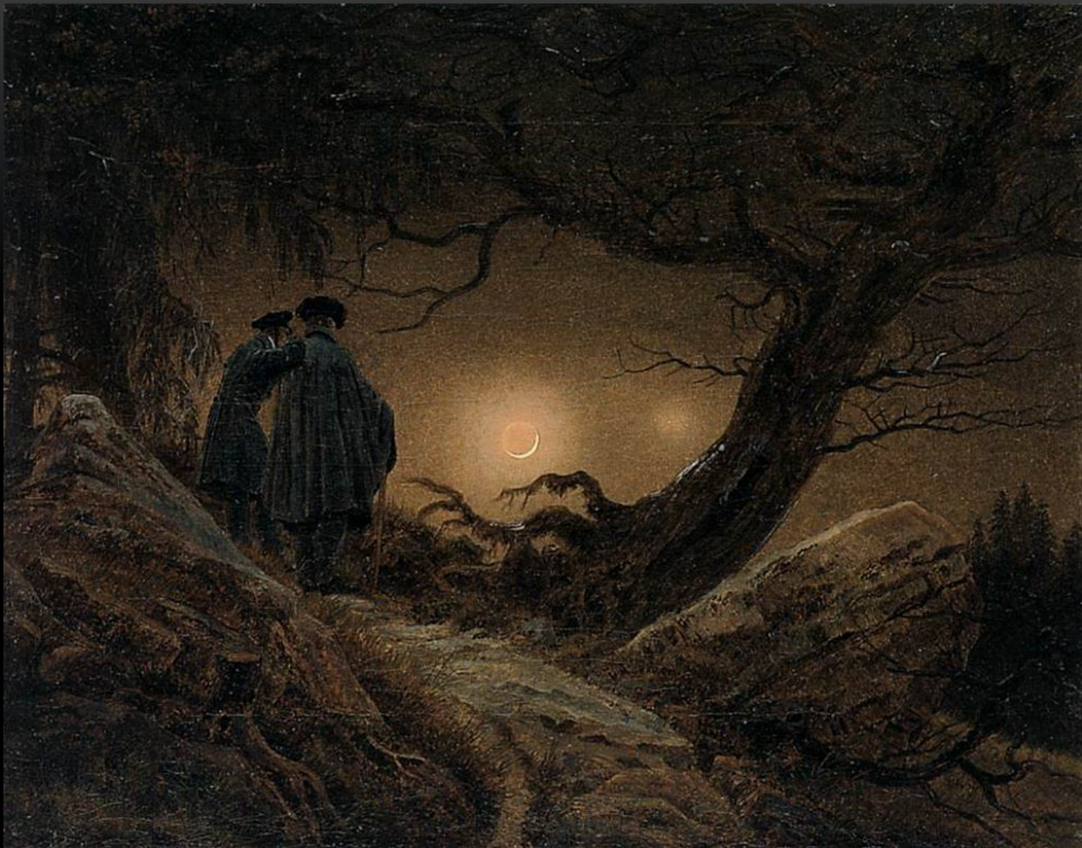
КАСПАР ФРИДРИХ ДВОЕ СОЗЕРЦАЮЩИЕ ЛУНУ