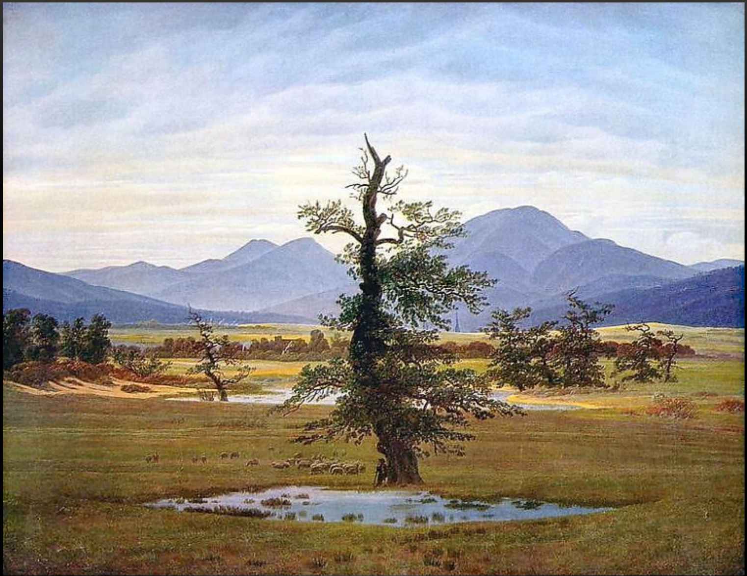
КАСПАР ФРИДРИХ ОДИНОКОЕ ДЕРЕВО