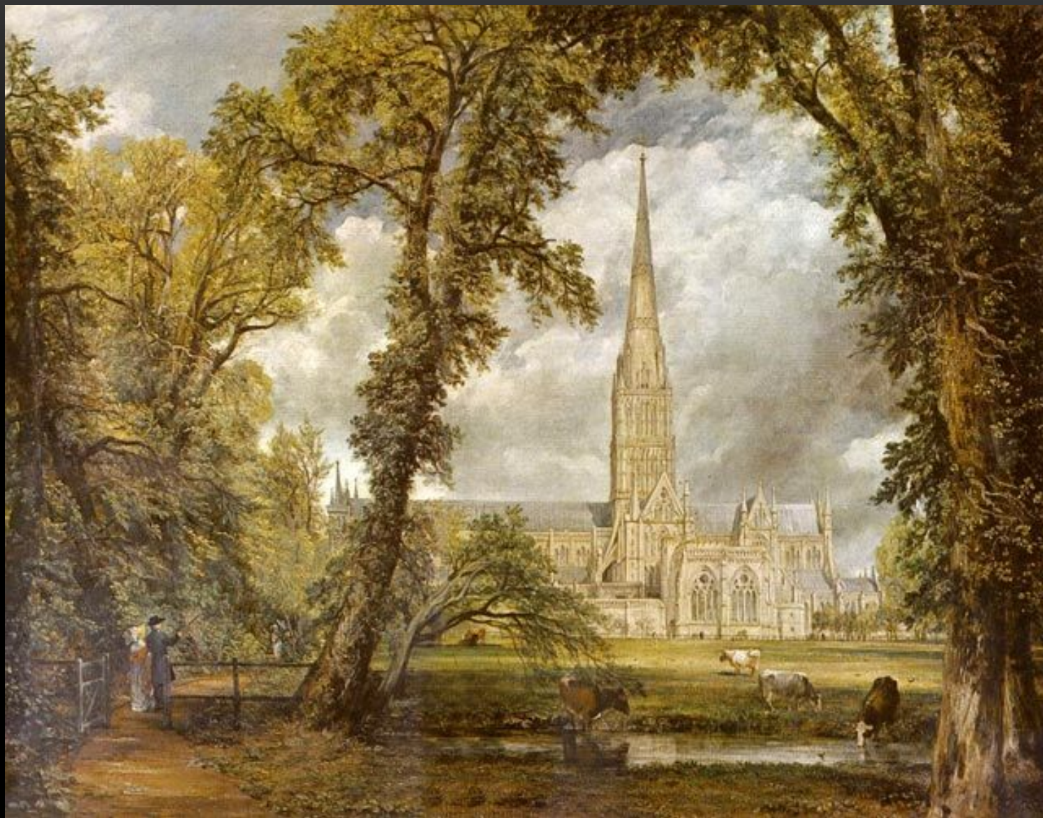
ДЖОН КОНСТЕБЛЬ СОБОР В СОЛСБЕРИ