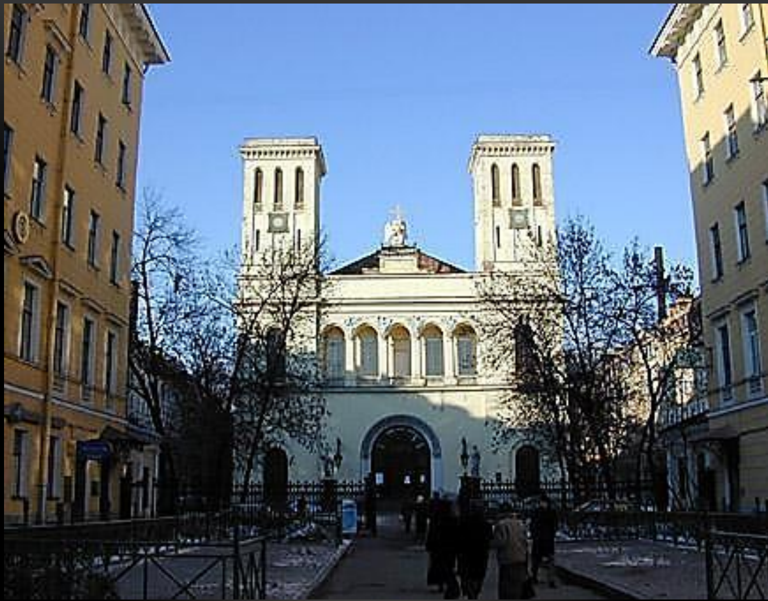
ЛЮТЕРАНСКАЯ ЦЕРКОВЬ В ПЕТЕРБУРГЕ АРХИТЕКТОР АЛЕКСАНДР БРЮЛЛОВ