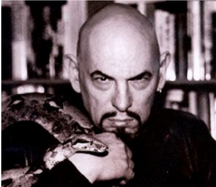
Антон Шандор ЛаВей