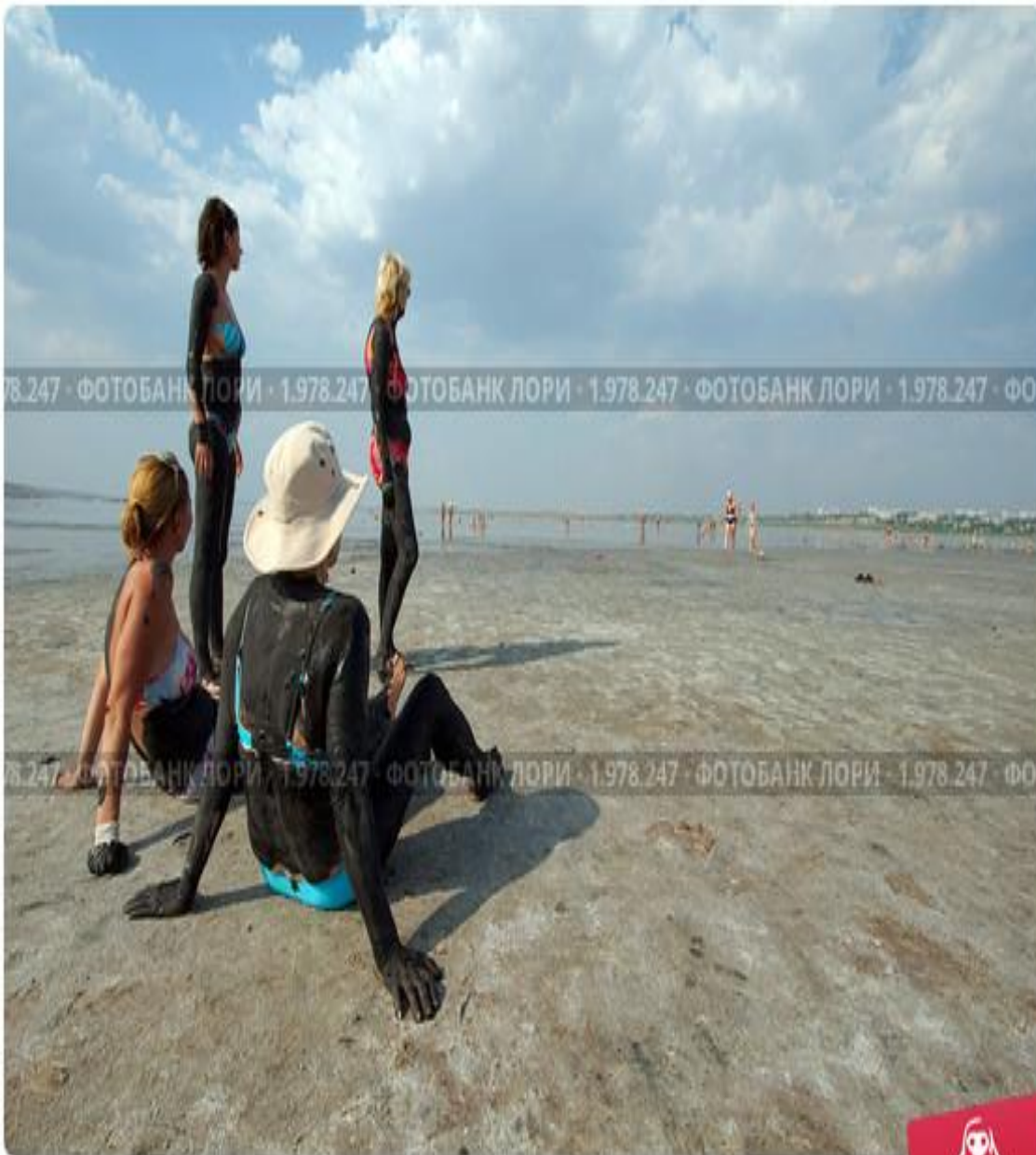
"Грязный" курорт - Куяльницкий лиман

Грязевые курорты привязаны к месторождениям лечебной грязи (пелоидов). Грязелечение показано преимущественно при патологии суставов, нервной системы травматического происхождения, а также при гинекологических и некоторых других заболеваниях.