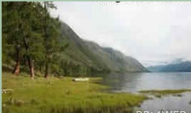
Грязевой курорт «Уш-Белдир»