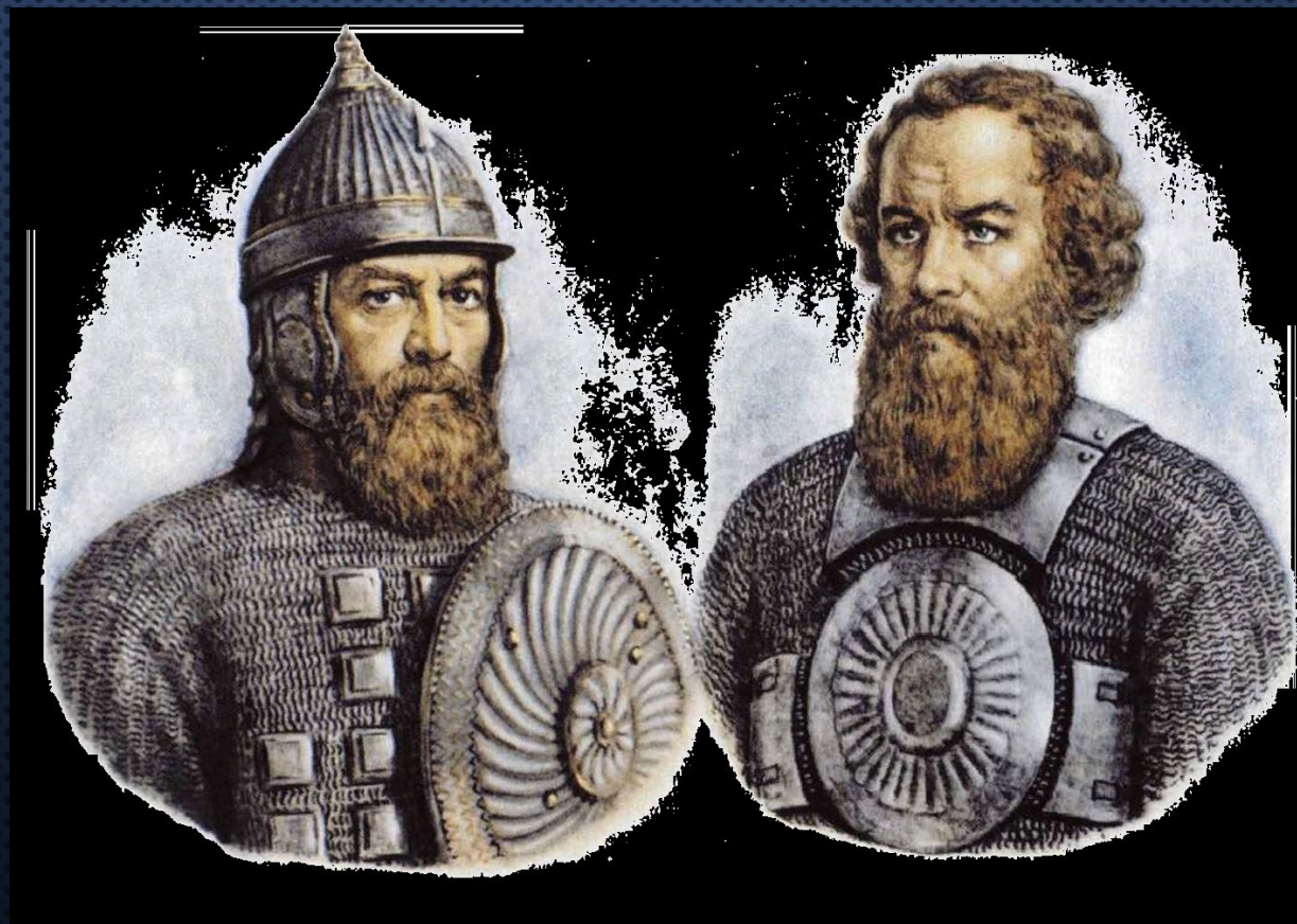
Кузьма́ Ми́нич Минин