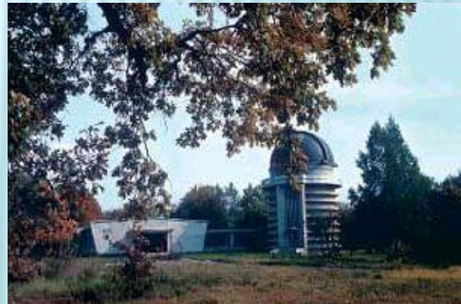
Подвійний ширококутний астрограф