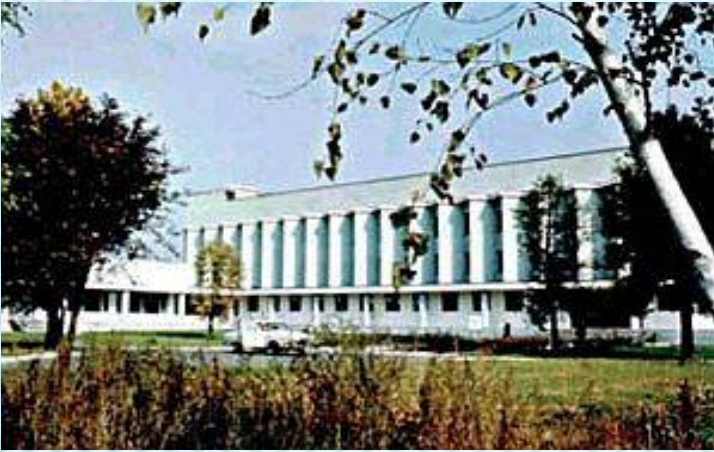
Головний корпус Обсерваторії