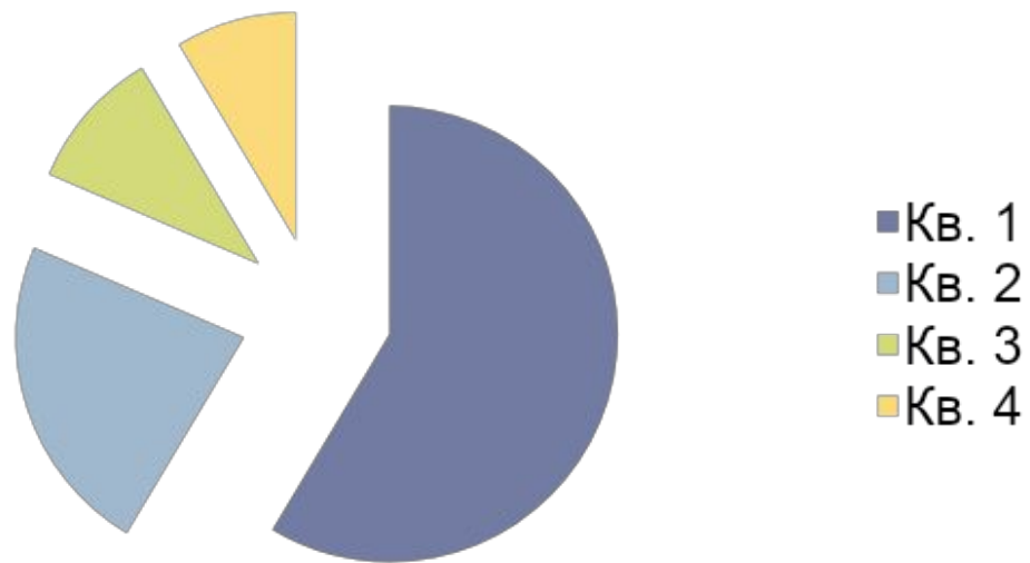
Результаты исследования знаний в сфере акцентуаций в группе БУП-311