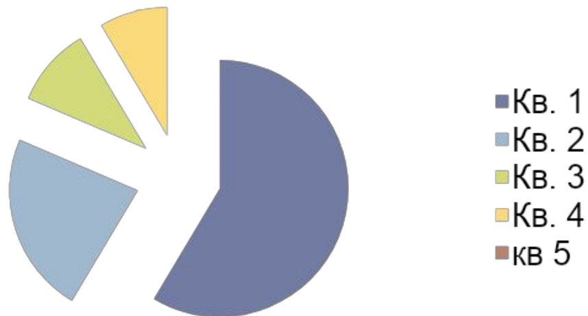
Результаты исследования гр БУП-312 по опроснику Шмишека