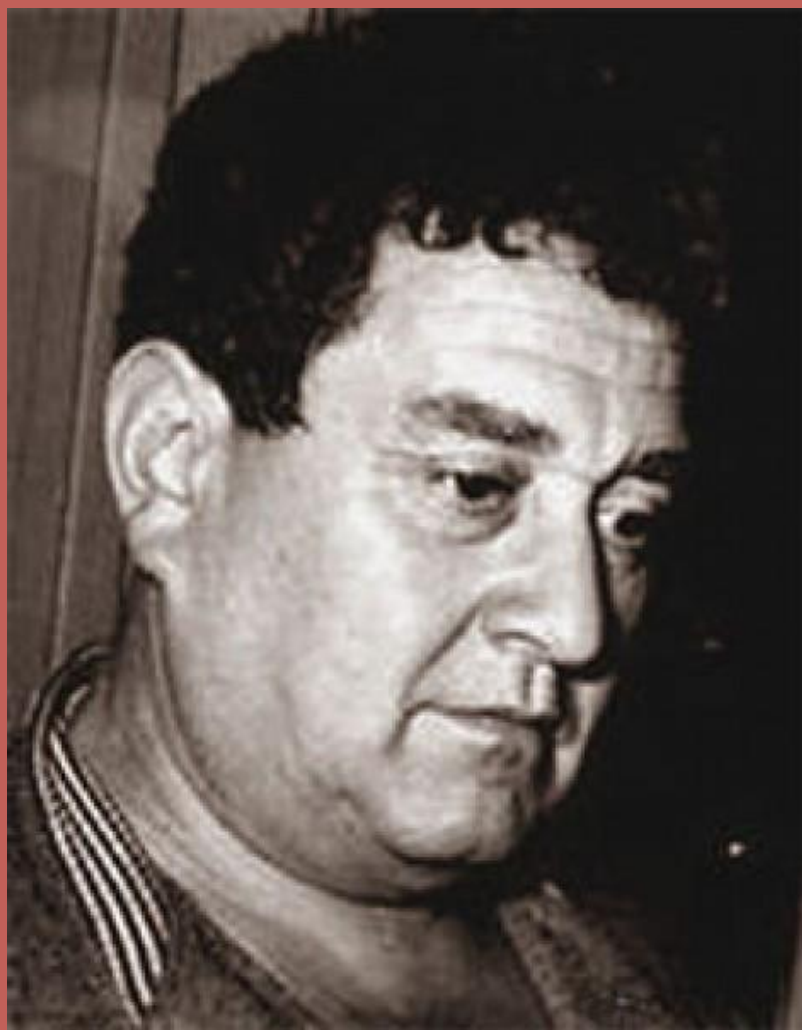
Драгунский Виктор Юзефович