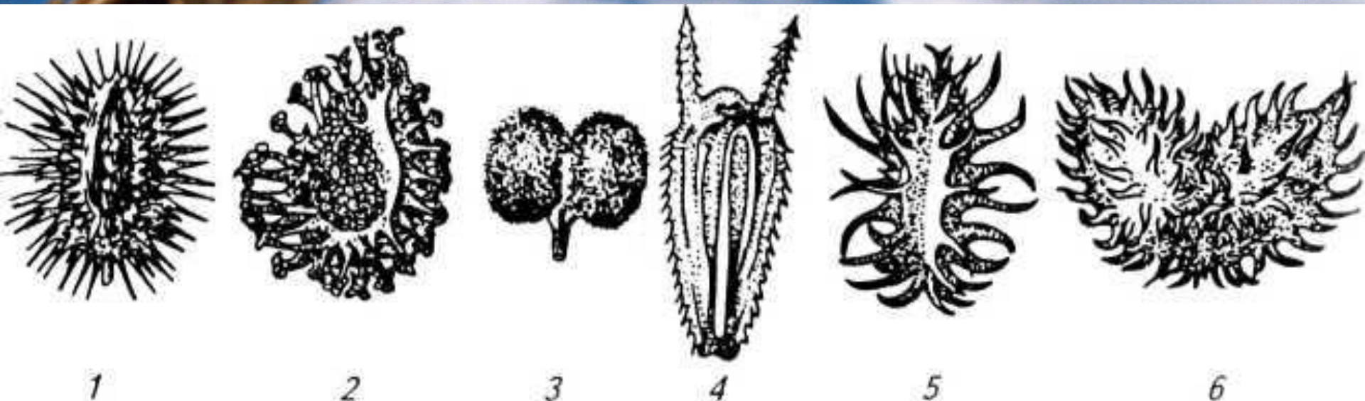
Рис. 9. Плоды сорняков с прицепками:

1 — морковь дикая; 2 — липучка ежевидная; 3 — подмаренник цепкий; 4 — череда; 5 - репейник; 6 — дурнушник