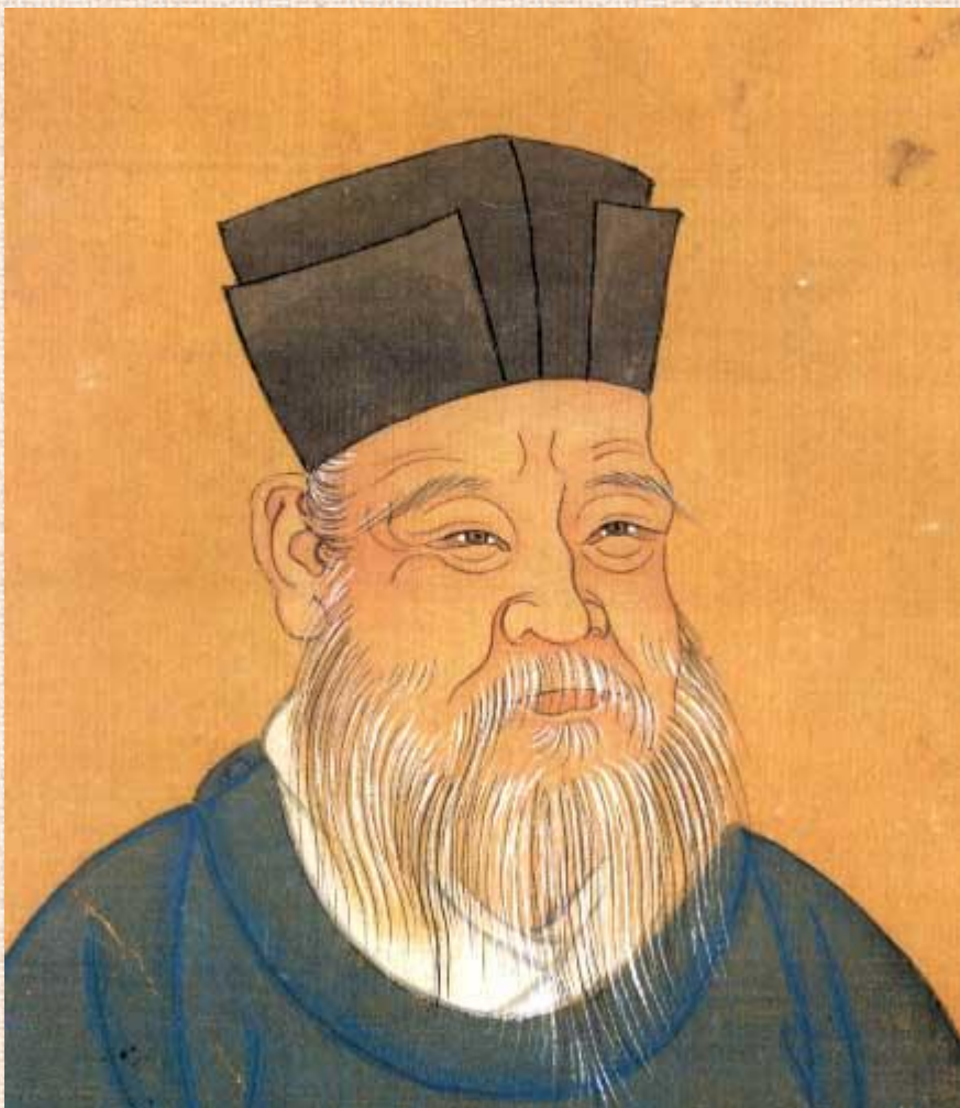
Чжу Си 朱熹 (1130-1200)

Текст: 四書集註 «Сводный комментарий к Четверокнижию»