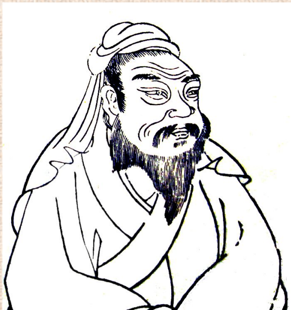
Чжоу-гун (周公, XI в. до н. э.)