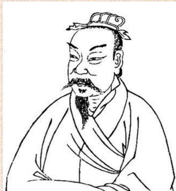
Гуань Чжун (管仲, 725-645 гг. до н.э.)