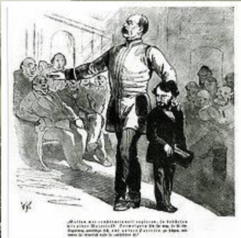
Бисмарк и Ласкер В парламенте

Страхование на случай старости и неспособности к труду