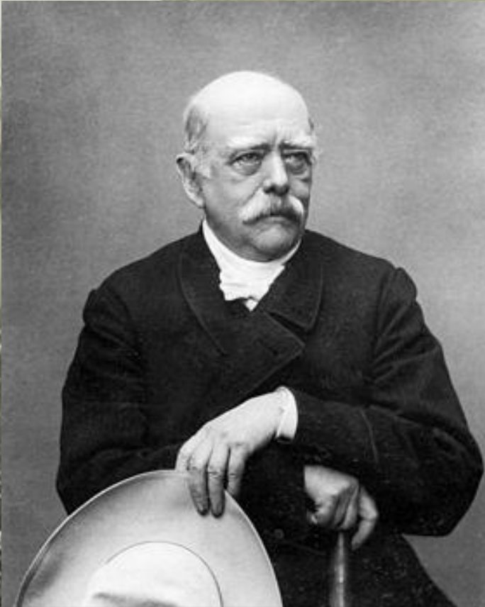
Отто фон Бисмарк

Политическое устройство Германии отражало взгляды «железного канцлера» и прусского юнкерства.