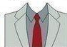
- СВЕТЛЫЙ КОСТЮМ, - СРЕДНИХ ТОНОВ РУБАШКА, - ТЕМНЫЙ ГАЛСТУК