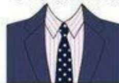
РИСУНКИ ГАЛСТУКА И РУБАШКИ РАЗНЫЕ, НО СОВПАДАЮТ ПО ЦВЕТУ