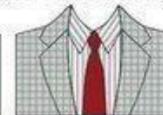
РИСУНКИ ПИДЖАКА И РУБАШКИ РАЗНЫЕ, НО СОВПАДАЮТ ПО ЦВЕТУ