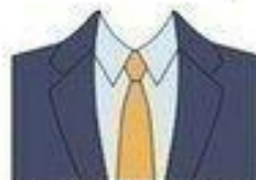
- ТЕМНЫЙ КОСТЮМ, - СВЕТАЯ РУБАШКА, - ГАЛСТУК ЛЮБОГО ЦВЕТА