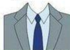
- СРЕДНИХ ЦВЕТОВ КОСТЮМ, - СВЕТАЯ РУБАШКА, - ТЕМНЫЙ ГАЛСТУК