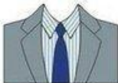
РИСУНОК РУБАШКИ И ГАЛСТУК ОДНОГО ЦВЕТА