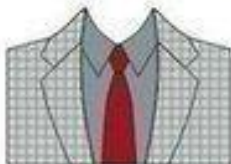
РИСУНОК ПИДЖАКА И РУБАШКА ОДНОГО ЦВЕТА