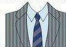
РИСУНКИ ПИДЖАКА И ГАЛСТУКА ОДИНАКОВЫЕ, НО РАЗЛИЧАЮТСЯ ПО МАСШТАБУ