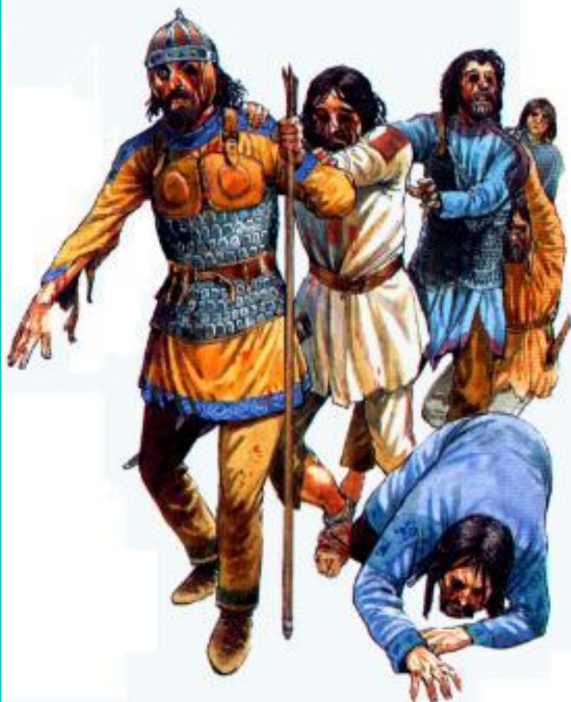
Ослепленные болгары. Современный рисунок.

Василий убил ок. 100 тыс болгар, 14 тыс. было ослеплено и в качестве устрашения отправлено домой.