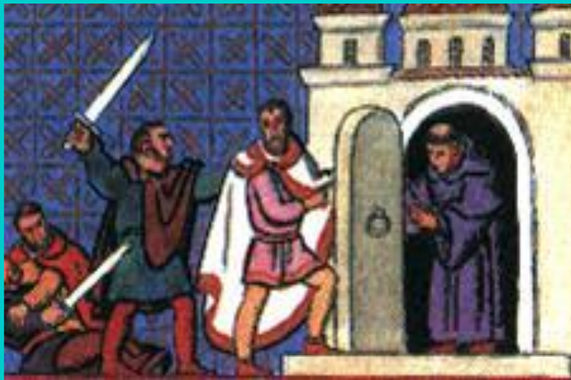
Житие Пшемысла. Миниатюра из летописи.

В начале X века из Моравской державы выделилось Чешское государство .