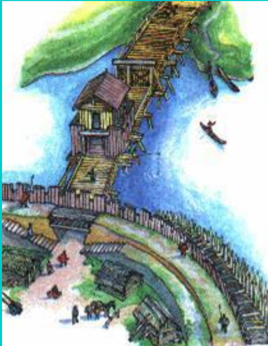
Схема крепости в Микульчице.

Для борьбы с Германией Моравия заключила союз с Византией.