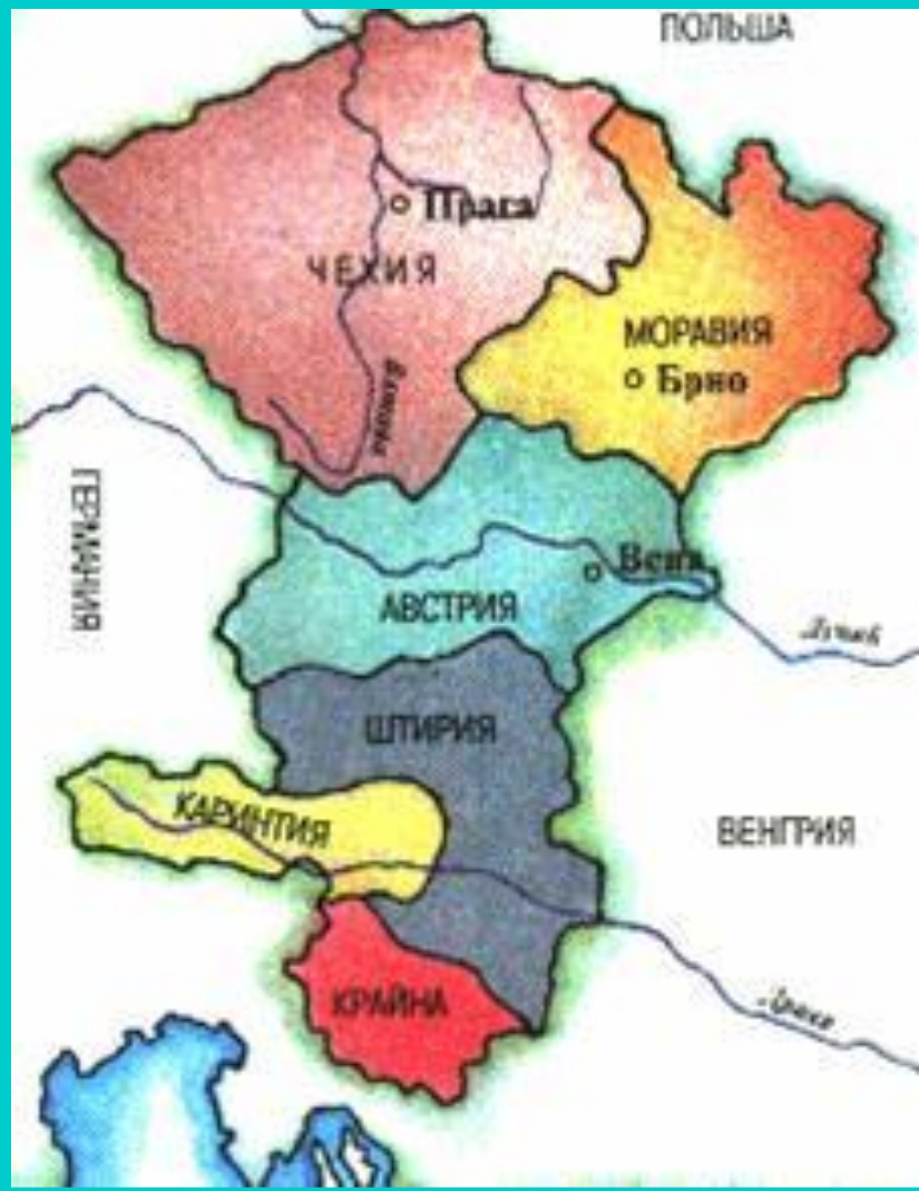
Чехия в 10-11 вв.

Болеслав стал сильным князем-он успешно боролся с Германией, подчинил соседей и границы Чехии дошли до Русских земель