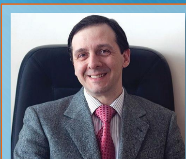
Судья от РФ