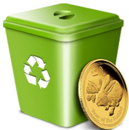
Единый тариф регионального оператора

Расходы регионального оператора по обезвреживанию, захоронению, обработке (сортировке) отходов