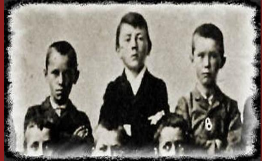
Гітлер (в центрі) з однокласниками. 1900 рік

Дитинство Гітлера було сповнене переїздами з одного місця на інше. Адольф ріс в атмосфері сурового батьківського контролю та безмежного материнського кохання. У вересні 1900 року Адольф вступив у перший клас державної реальної школи в Лінці. Зміна сільської школи на велику і чужу реальну школу в місті Адольфу не сподобалася. З цього часу Адольф почав вчити тільки те, що йому подобалося — історію, географію і в особливості малювання; все інше не помічав. В результаті такого ставлення до навчання, він залишився на другий рік у першому класі реальної школи. Коли 13-річний Адольф навчався у другому класі реальної школи в Лінці, 3 січня 1903 року несподівано помер батько.