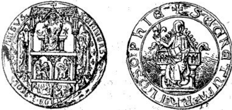
Печать Парижского университета. XIII в.

Университетское образование с самого начала было открыто для представителей других народов