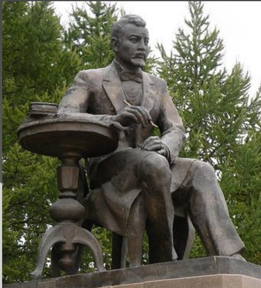
Ахмет Байтұрсыновқа арналған ескерткіштер