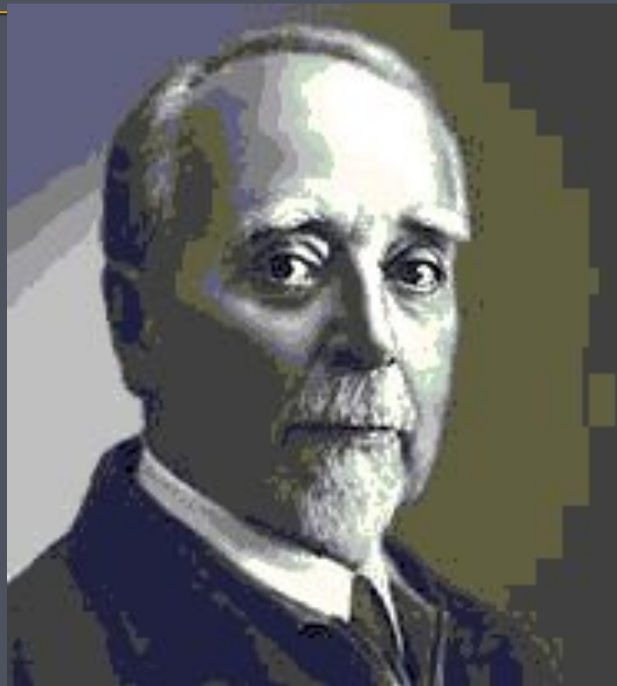
Г. Кржижановский председатель ГОСПлана

План был рассчитан на 10-15 лет и состоял из двух основных программ. Программа А предусматривала восстановление и реконструкцию довоенной электроэнергетики. Программа Б — строительство 30 электростанций (20 тепловых и 10 ГЭС) в основных регионах страны с учетом их природных ресурсов и потребностей развития промышленности