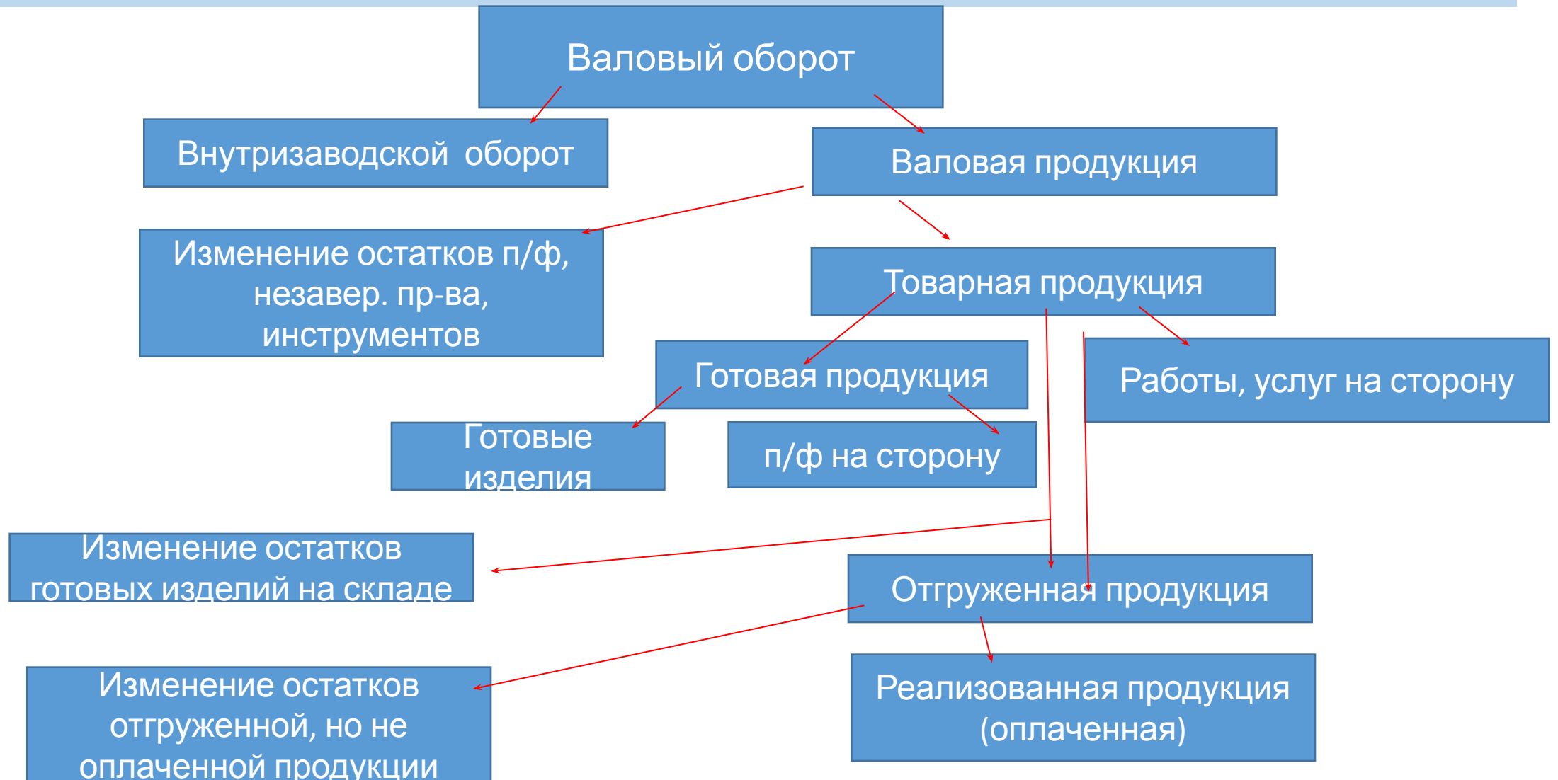
Схема состава валового оборота