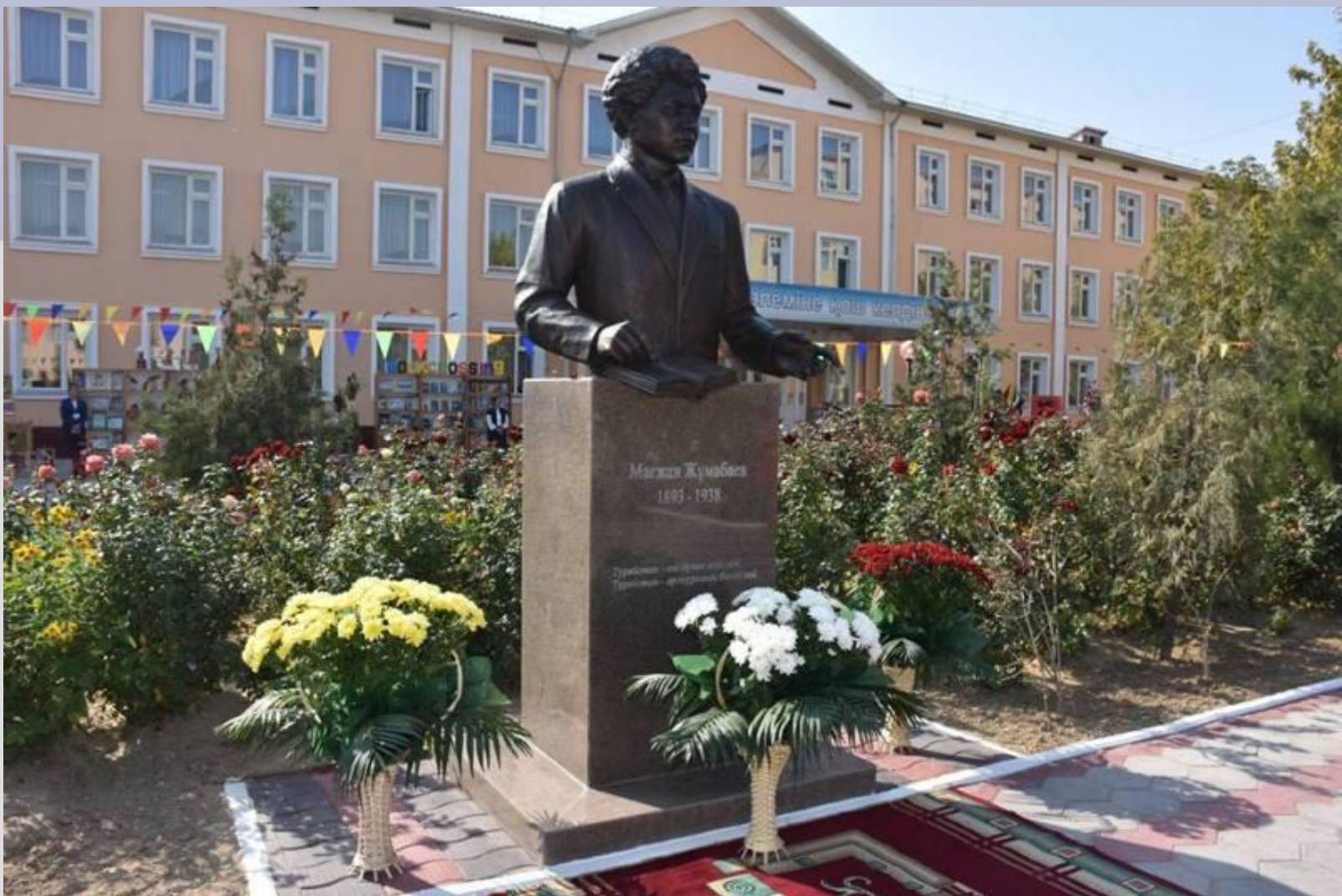
Түркістанда Мағжан Жұмабаевтың ескерткіші