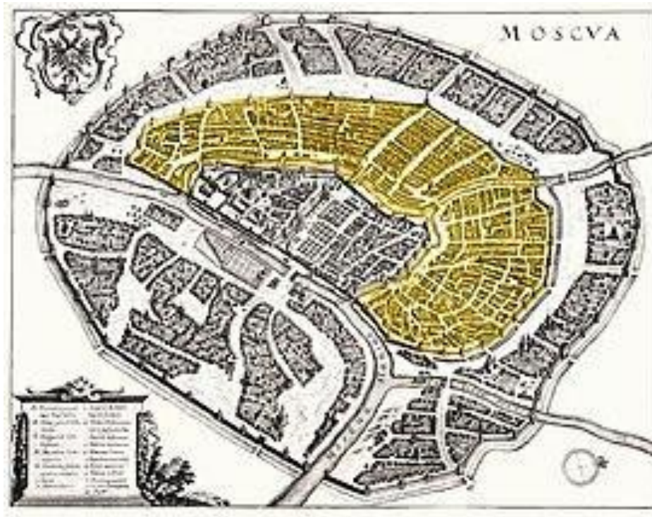
Белый город на плане Мериана (1638) выделен жёлтым цветом.