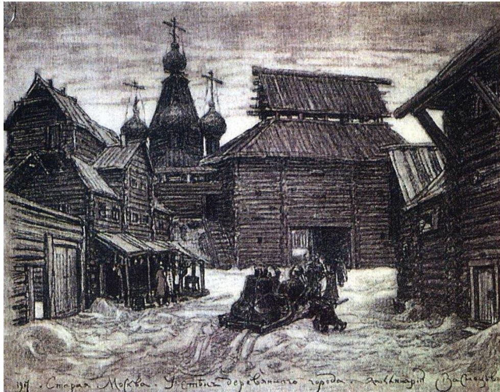
А. М. Васнецов. У стен Деревянного города.