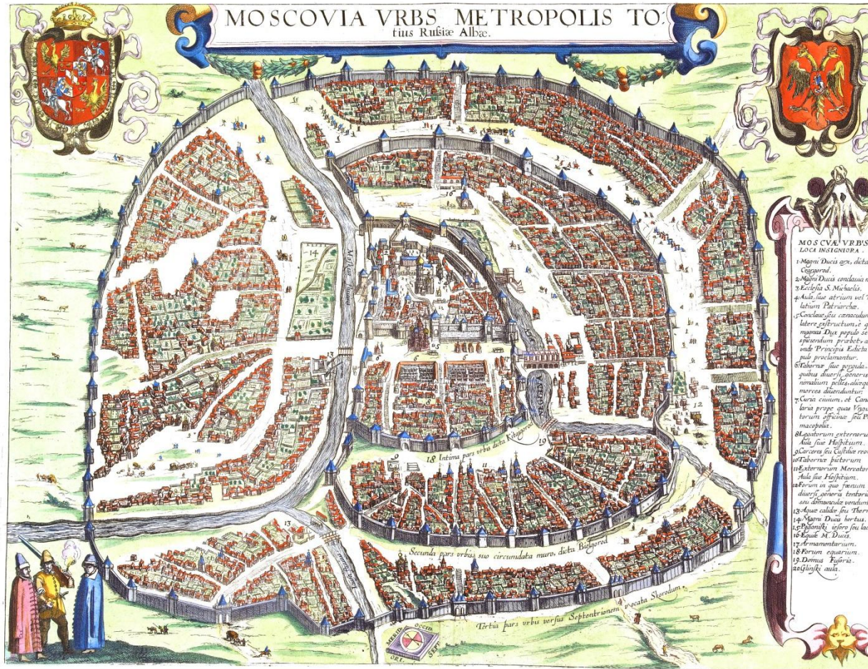
Карта Москвы с указанием кварталом. 1610 г.