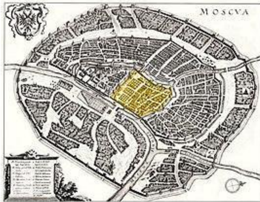
Китай-город на плане (1638) Маттеуса Мериана выделен жёлтым цветом.