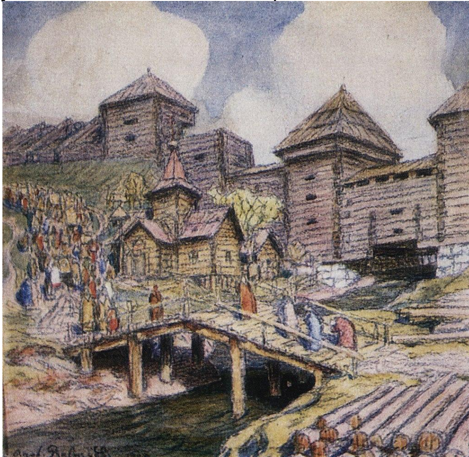
А.Васнецов. Стены Деревянного города над рекой Яузой