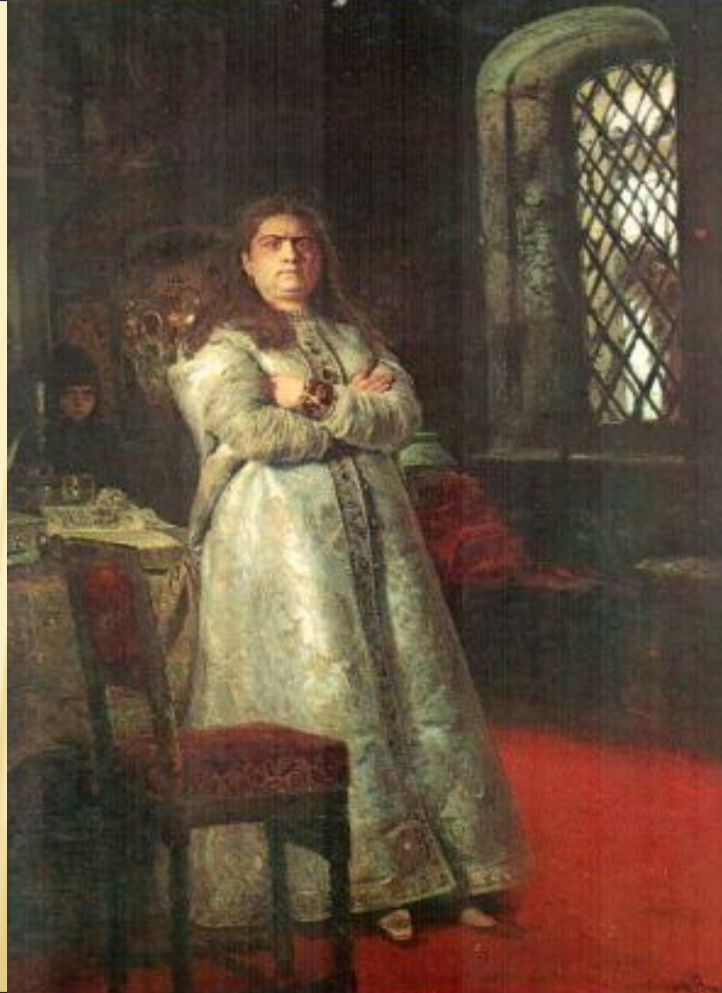
И.Е.Репин(1844-1930) «Царевна Софья Алексеевна.1879г.»