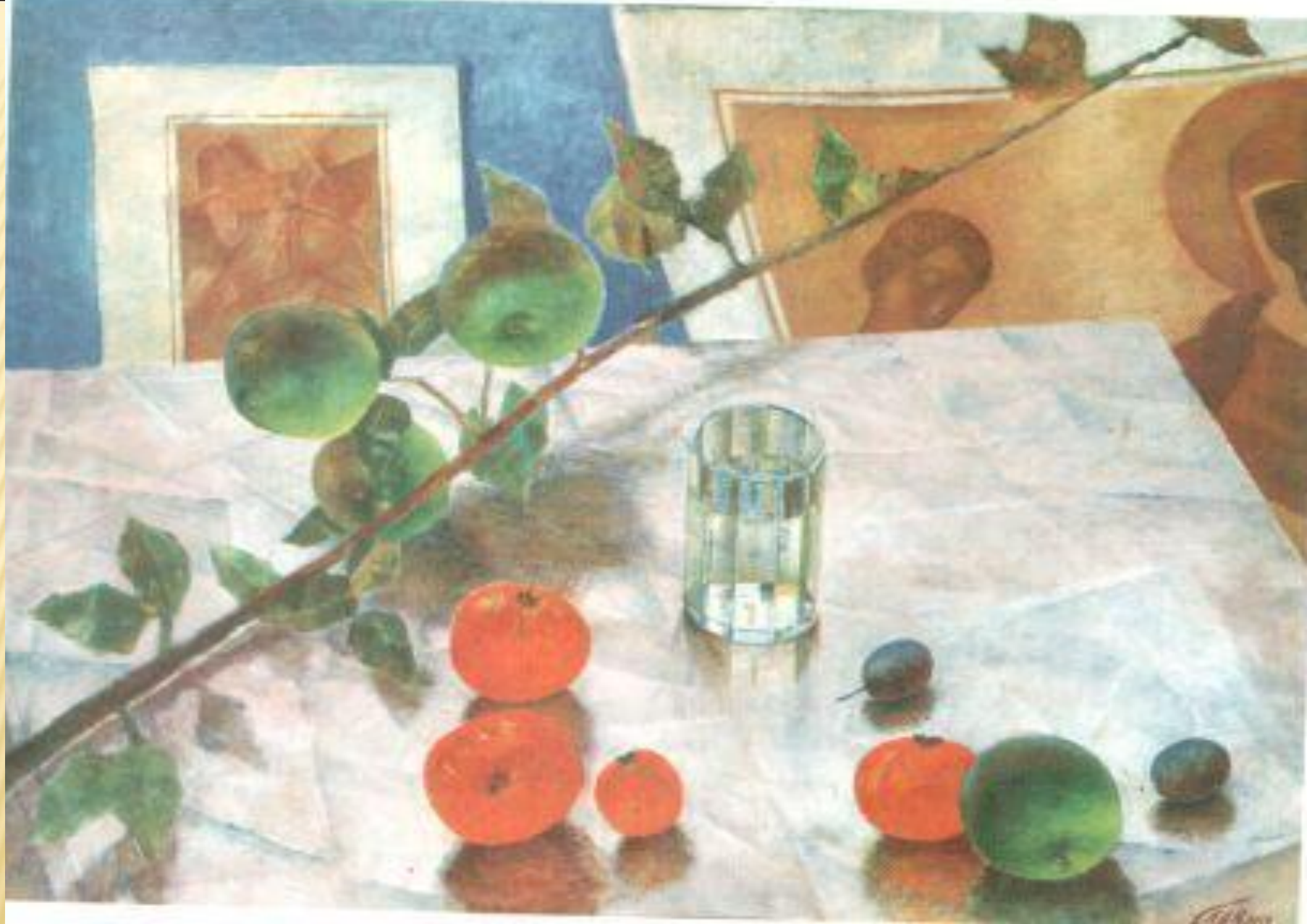
К.С.Петров-Водкин(1878-1939) «Розовый натюрморт. Ветка яблони».1918г.