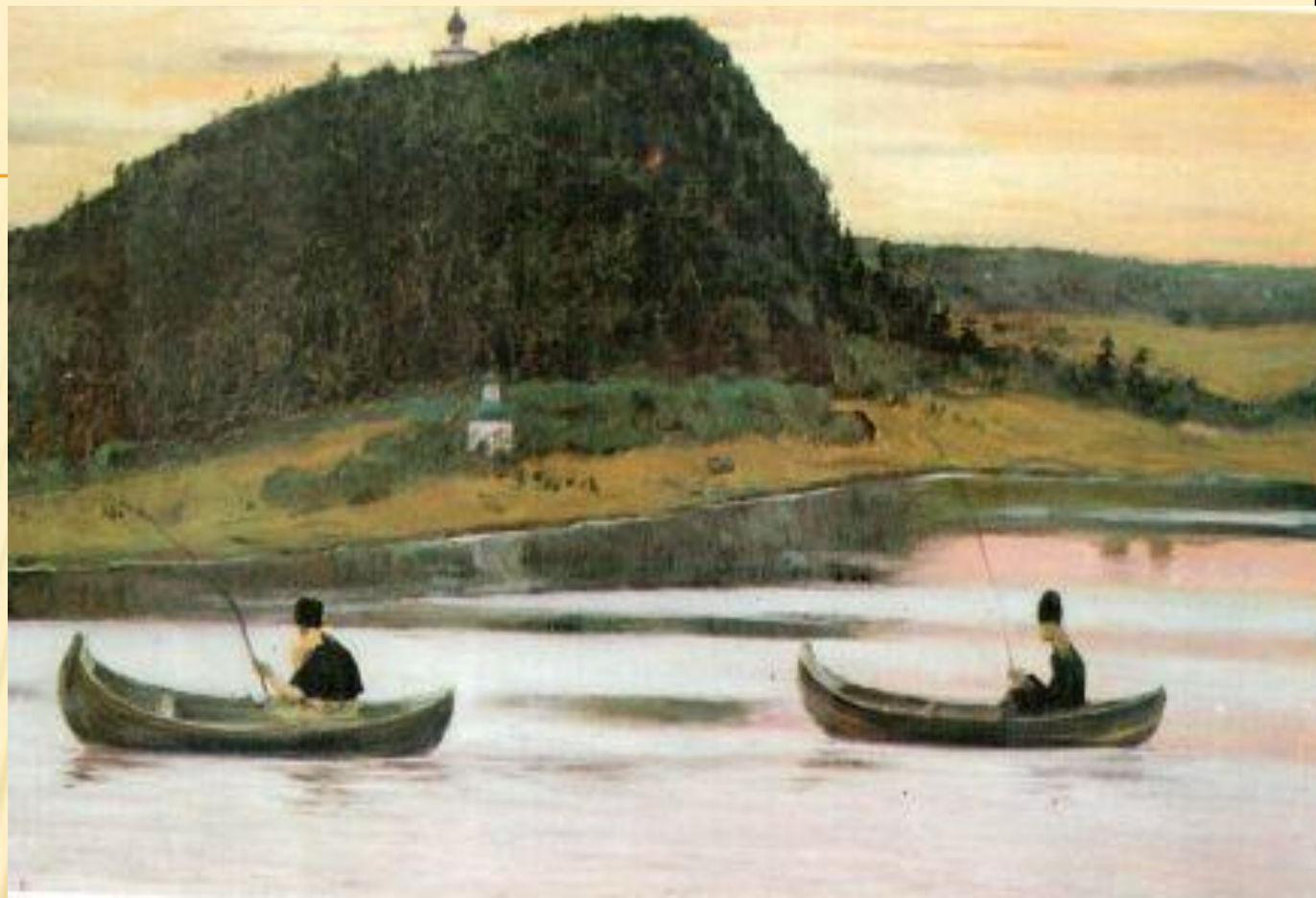
М.В. Нестеров (1862-1942). «Молчание».1903

«Я... желал бы оставить национальную галерею...Для меня, истинно и пламенно любящего живопись, не может быть лучшего желания, как положить начало общественного, всем доступного хранилища изящных искусств, приносящего