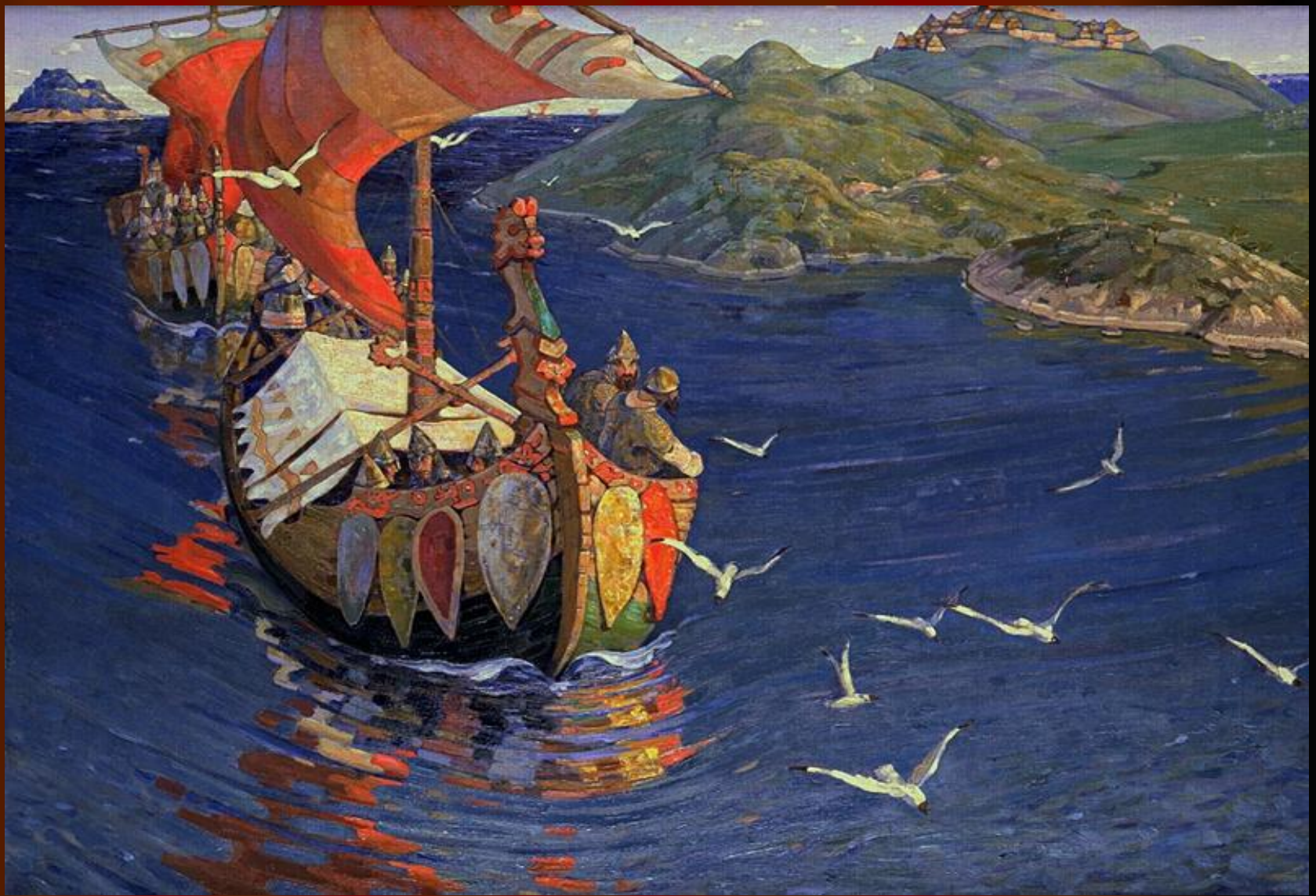
Н.К.Рерих. Заморские гости