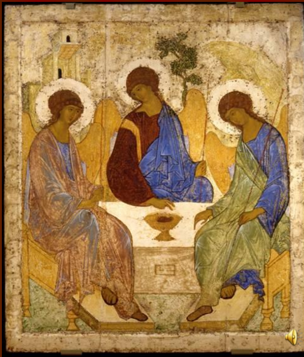
Андрей Рублев. Троица ветхозаветная