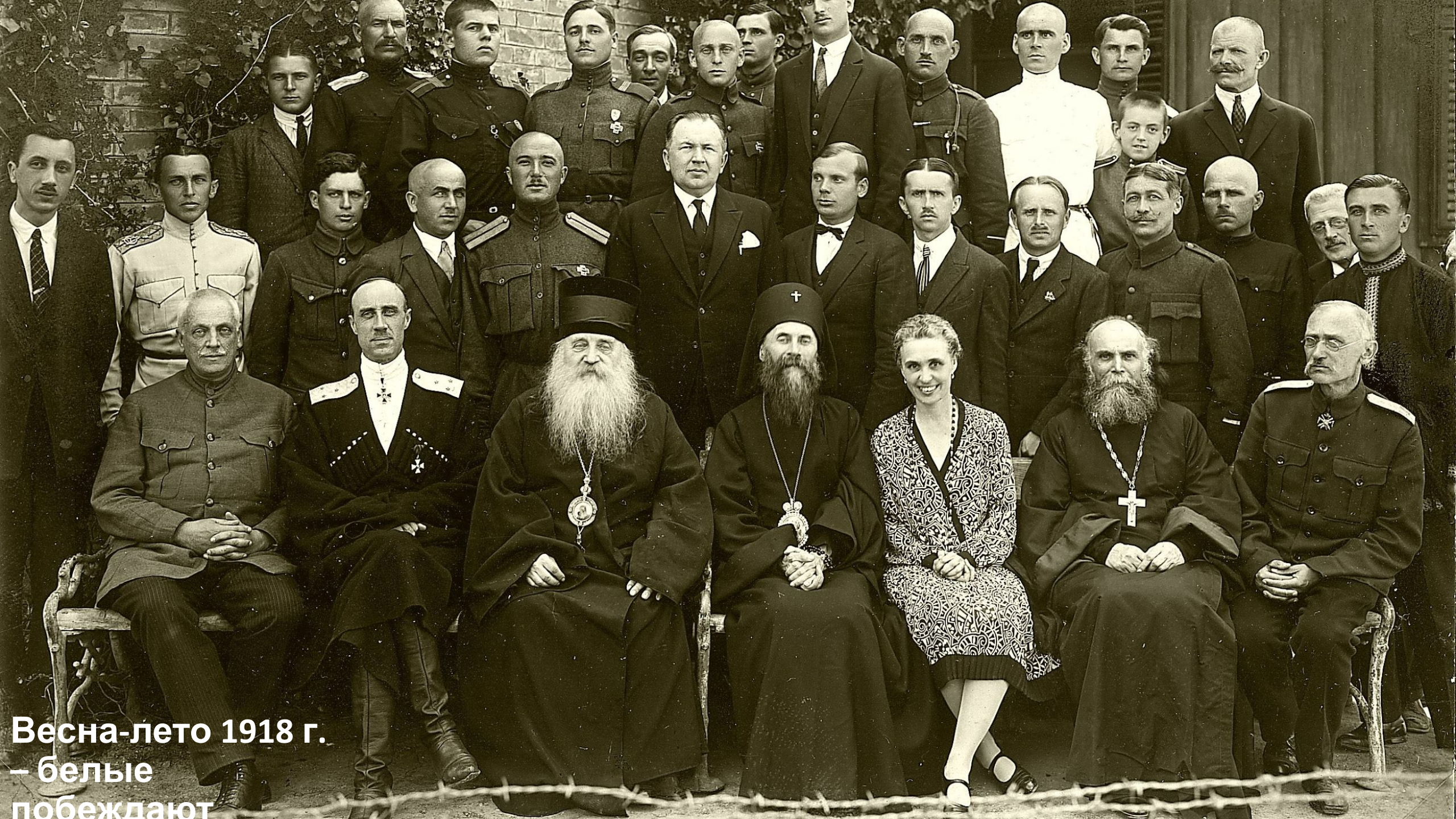
Весна-лето 1918 г. – белые побеждают