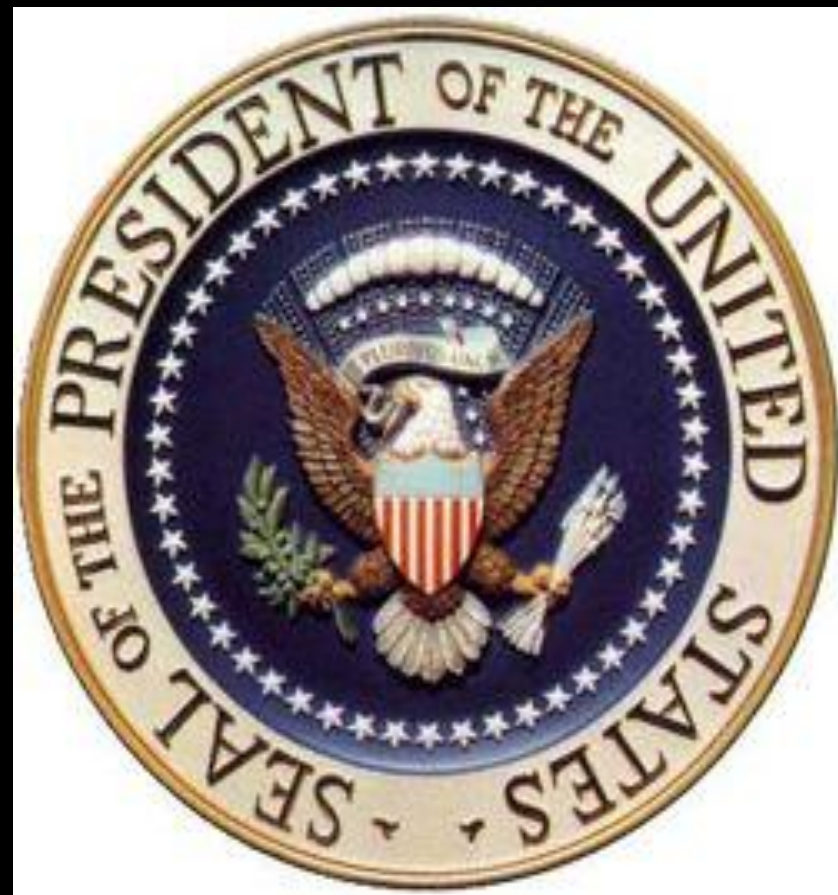
Печать Президента США