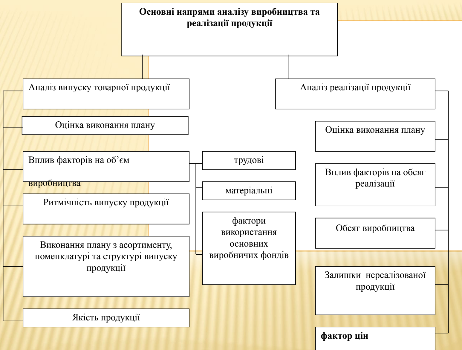
Рис. 7.1 - Схема аналізу виробництва і реалізації продукції