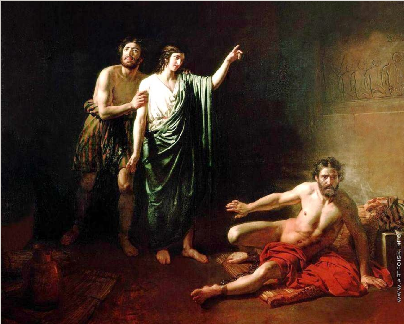
ИОСИФ, ТОЛКУЮЩИЙ СНЫ ЗАКЛЮЧЕННЫМ С НИМ В ТЕМНИЦЕ ВИНОЧЕРПИЮ И ХЛЕБОДАРУ 1827