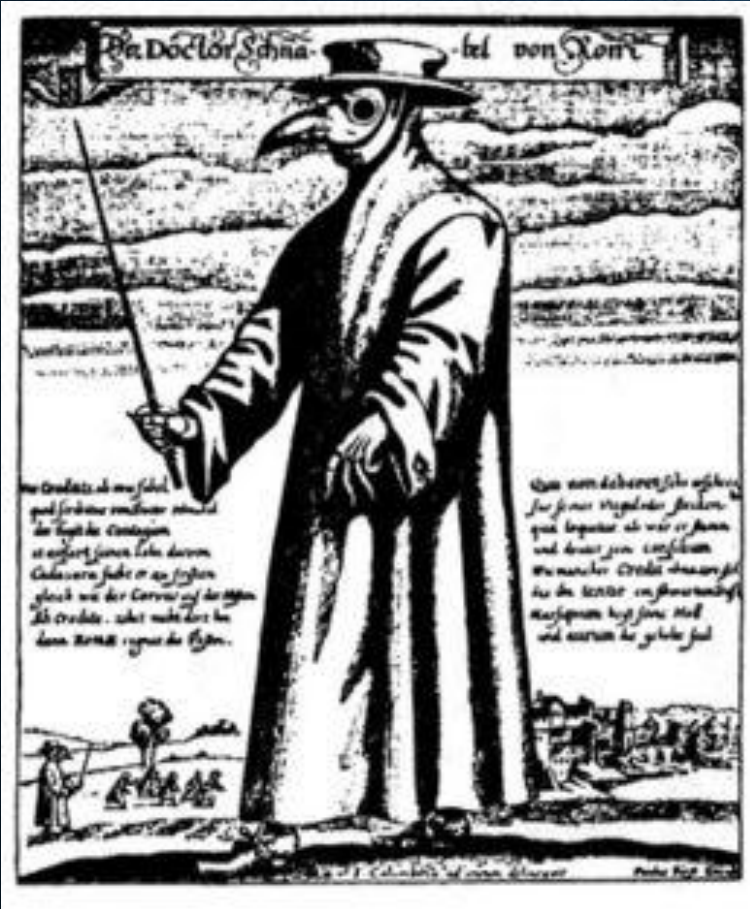
Doctor mascat din timpul “ciumei” (1656)