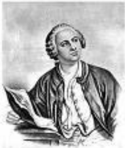
М. В. Ломоносов

Первый русский ученый-естествоиспытатель мирового значения, человек энциклопедических знаний, разносторонних интересов и способностей, один из основоположников физической химии. Поэт, заложивший основы литературного языка, художник. Историк, поборник отечественного просвещения и развития самостоятельной русской науки. «...Все перемены, в натуре случающиеся. Такого суть состояния, что сколько чего у одного тела отыметя, столько присовокупитя к другому... Сей всеобщий естественный закон простирается и в самые правила движения: ибо тело, движущее своею силою другое. столько же оныя у себя теряет, сколько сообщает другому, которое от него движение получает.»