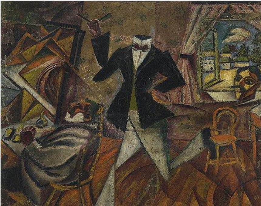
"Парикмахер без головы" Д. Бурлюк