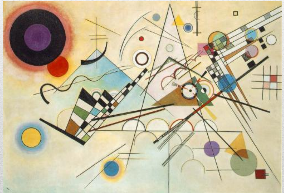
Василий Кандинский. Композиция VIII