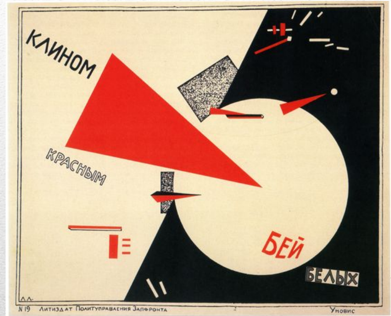
Клином красным бей белых. Автор: Лазарь Маркович Лисицкий