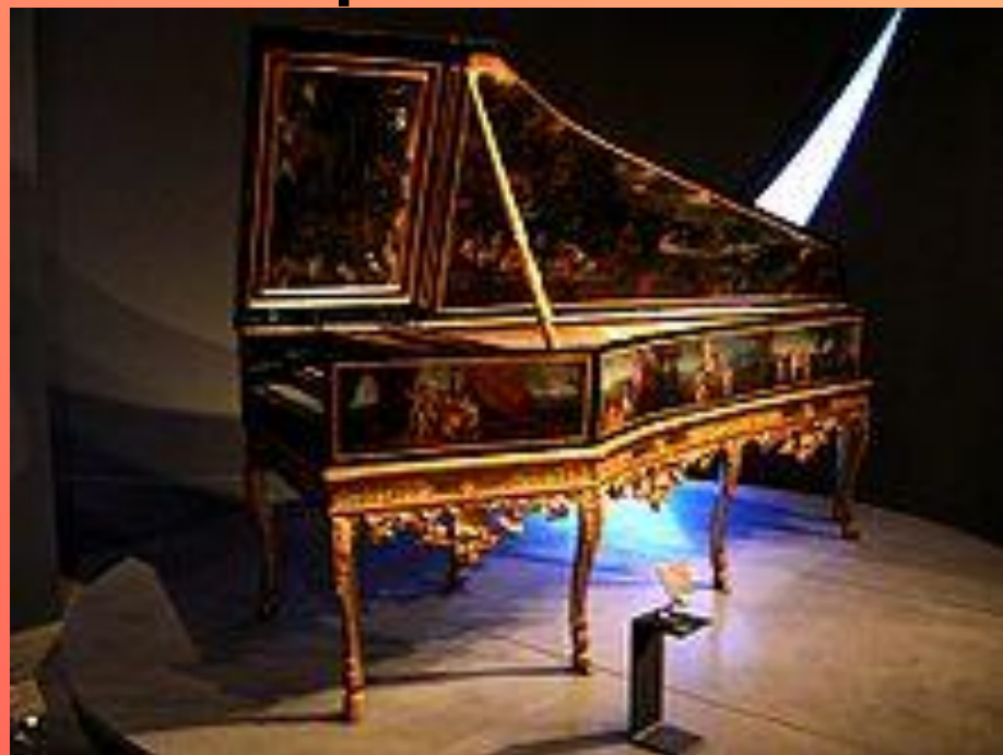
Французский клавесин 17-го века

Предшественниками фортепиано являлись КЛАВЕСИН и изобретённый позднее КЛАВИКОРДЫ .